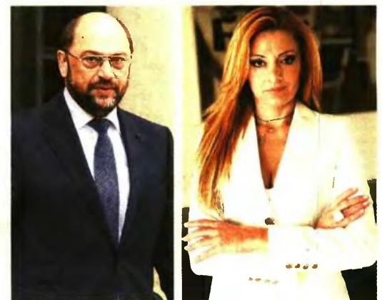
Ο Μάρτιν Σουλτς αλλά και ο Γιούνκερ με επιστολή του, «άδειασαν» την κυβέρνηση μετά από ερώτημα της δικηγόρου, Αριάδνης Νούκα,