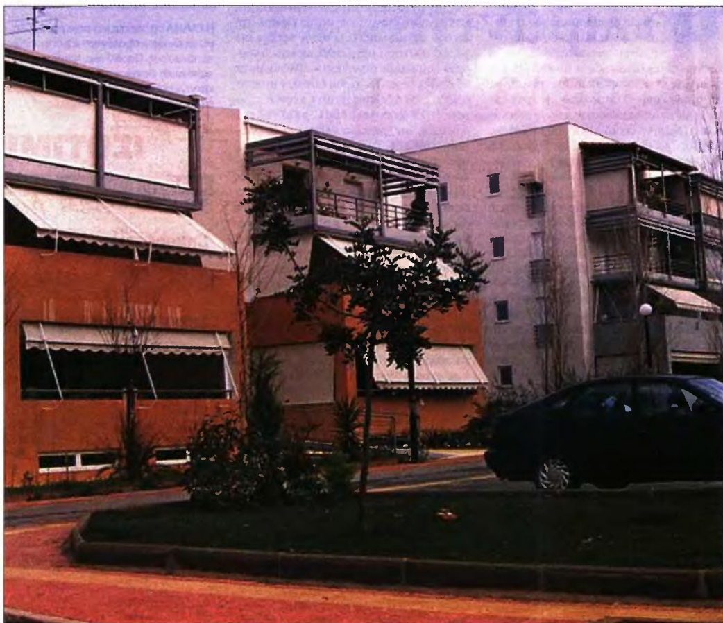
Σπίτια του πρώην Οργανισμού Εργατικής Κατοικίας στους Θρακομακεδόνες