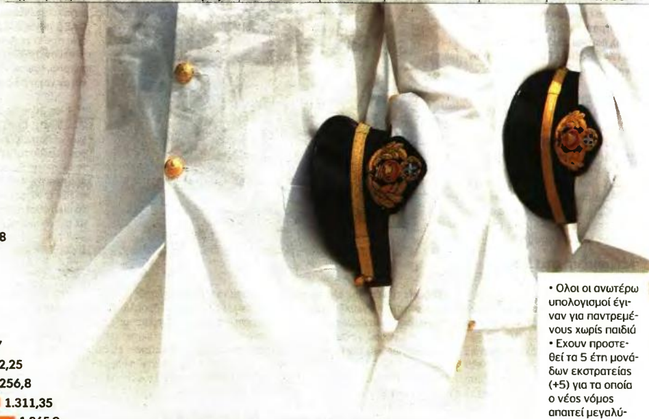
Επεξεργασία: Γιάννης Αντωνιάδης, εργατολόγος, οικονομολόγος

• Όλοι οι ανωτέρω υπολογισμοί έγιναν για παντρεμένους χωρίς παιδιά • Έχουν προστεθεί τα 5 έτη μονάδων εκστρατείας (+5) για τα οποία ο νέος νόμος απαιτεί μεγαλύτερες εισφορές αναγνώρισης