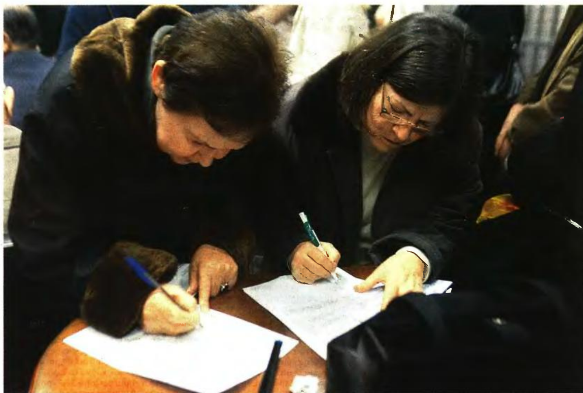
Σημαντικές είναι οι αποκλίσεις όσον αφορά το προβλεπόμενο όριο ηλικίας, ανάλογα με το πότε ο ασφαλισμένος θεμελιώνει δικαίωμα συνταξιοδότησης

► Όσοι συνταξιοδοτούνται με 15ετία θα λαμβάνουν την Εθνική Σύνταξη μειωμένη κατά 10%