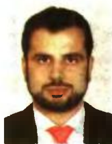
Γράφει ο Διονύσιος Ρίζος

Από τα νέα εισοδηματικά κριτήρια θα χάσουν το ΕΚΑΣ ή θα τοποθετηθούν σε χαμηλότερες κατηγορίες περίπου