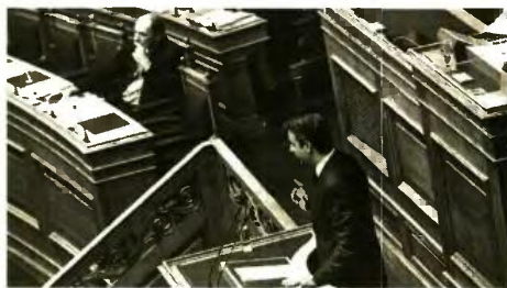
Διαγκωνισμός της κυβέρνησης με τη ΝΔ χτες στη Βουλή, για το ποιος έχει περισσότερο στο... DNA του τη στήριξη του κεφαλαίου

Στην ίδια βάση επέκρινε την κυβέρνηση για «λάθος δημοσιονομικό μείγμα», διαφημίζοντας τις προ-