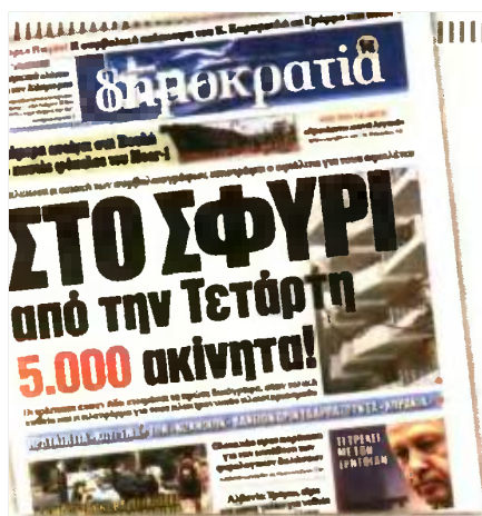
Τη Δευτέρα η «δημοκρατία» είχε προαναγγείλει την επιστροφή του εφιάλητη