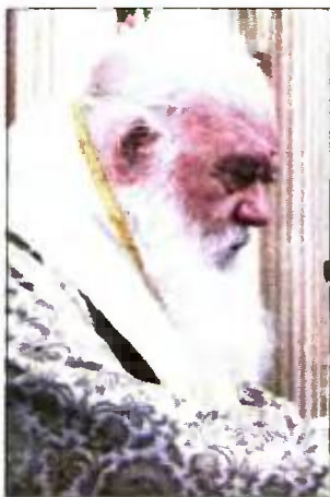
Ο Αρχιεπίσκοπος Ιερώνυμος στην τελετή ανακήρυξης του ως επίτιμος δημότης στην Αμφιλοχία

«ΟΙ ΕΛΛΗΝΕΣ είναι κουρασμένοι και αυτή η κόπωση δεν θα βγάλει σε καλό!» προειδοποίησε από την Αμφιλοχία ο Αρχιεπίσκοπος Ιερώνυμος στην τελετή ανακήρυξης του ως επίτιμος δημότης. Ο Αρχιεπίσκοπος στην ομιλία του ανέφερε με νόημα ότι δεν επιθυμεί την ανάμειξή του στα πολιτικά θέματα, ωστόσο και ο ίδιος δεν μπορεί να αγνοεί τις ανησυχίες του μαστιζόμενου από την κρίση λαού.