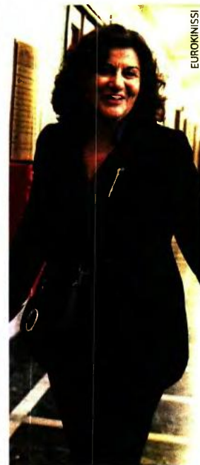
Πάνω: Η αναπληρώτρια υπουργός Κοινωνικής Αλληλεγγύης Θεανώ Φωτίου υπέγραψε χθες την απόφαση που αποκλείει ή ψαλιδίζει τα ποσά για κυλιάδες τρίτεκνες και πολύτεκνες οικογένειες. Αριστερά: Φωτογραφία από πρόσφατη διαμαρτυρία τρίτεκνων έξω από το υπ. Εργασίας.