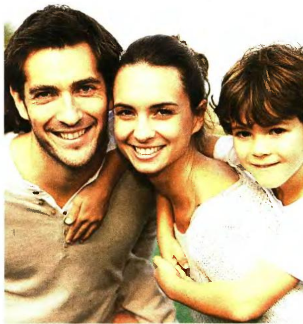
Το επίδομα χορηγείται σε παιδιά γεννημένα μέχρι την 31η Δεκεμβρίου του προηγούμενου έτους υποβολής της αίτησης

με 13.000€ ετήσιο εισόδημα: Επαίρνε 245€ τον μήνα, ενώ τώρα δικαιούται 280€ τον μήνα. Αύξηση 14,29%.