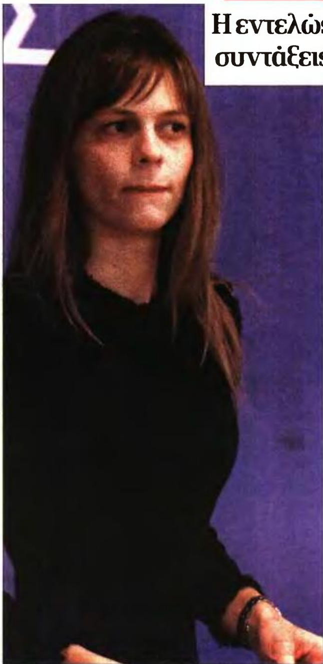
Η υπ. Εργασίας Εφη Αχτσιόγλου

ΗΛΙΚΙΑΚΟ όριο στον επιζώντα σύζυγο, μικρότερο ποσό σύνταξης και ακόμη πιο αυστηρές προϋποθέσεις στις περιπτώσεις διαζυγίου προβλέπονται για τις συντάξεις χηρείας, σύμφωνα με το νέο τοπίο που διαμορφώνεται με την εγκύκλιο του υπουργείου Εργασίας. Οι αλλαγές αφορούν όλες τις παροχές προς συζύγους και ανήλικα τέκνα, για θανάτους που επήλθαν από τις 13 Μαΐου 2016 και εφεξής, καθώς διαμορφώνονται ενιαίοι όροι για όλους, ακόμη και για τους αγρότες ασφαλισμένους στον ΟΓΑ.