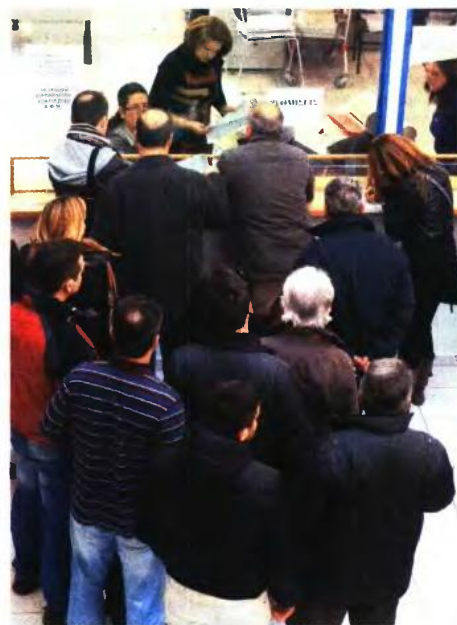
Τη διαφορά κάνει η ανταποδοτική σύνταξη, η οποία εξαρτάται από έτη ασφάλισης, συντελεστές αναπλήρωσης και συντάξιμες αποδοχές από το 2002 και μετά

Για τα έτη 2002, 2004, 2005, 2006, 2010, 2011, 2014, 2015 και 2016 ο ασφαλισμένος απασχολήθηκε ως μισθωτός. Για τα διαστήματα αυτά ο ασφαλισμένος κατέβαλλε ως μηνιαία εισφορά ένα σταθερό ποσό σε 12μηνη βάση και ο εργοδότης μηνιαία εισφορά ύψους 13,33% επί των αποδοχών σε 14μηνη βάση. Συνεπώς από 1/1/2002 έως και 30/6/2016, δηλαδή για 174 μήνες, έχουν καταβληθεί συνολικά 334.352,10€ και οι μηνιαίες συντάξιμες αποδοχές ανέρχονται σε 1.921,56€ (334.352,10€ / 174 μήνες). Το ποσό της ανταποδοτικής σύνταξης ανέρχεται σε 723,66€ (1.921,56€ X 37,66%).