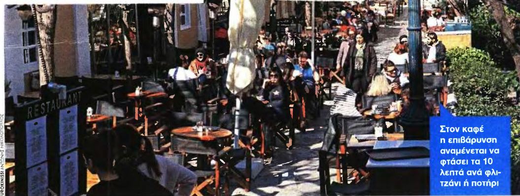
Στον καφέ η επιβάρυνση αναμένεται να φτάσει τα 10 λεπτά ανά φλιτζάνι ή ποτήρι