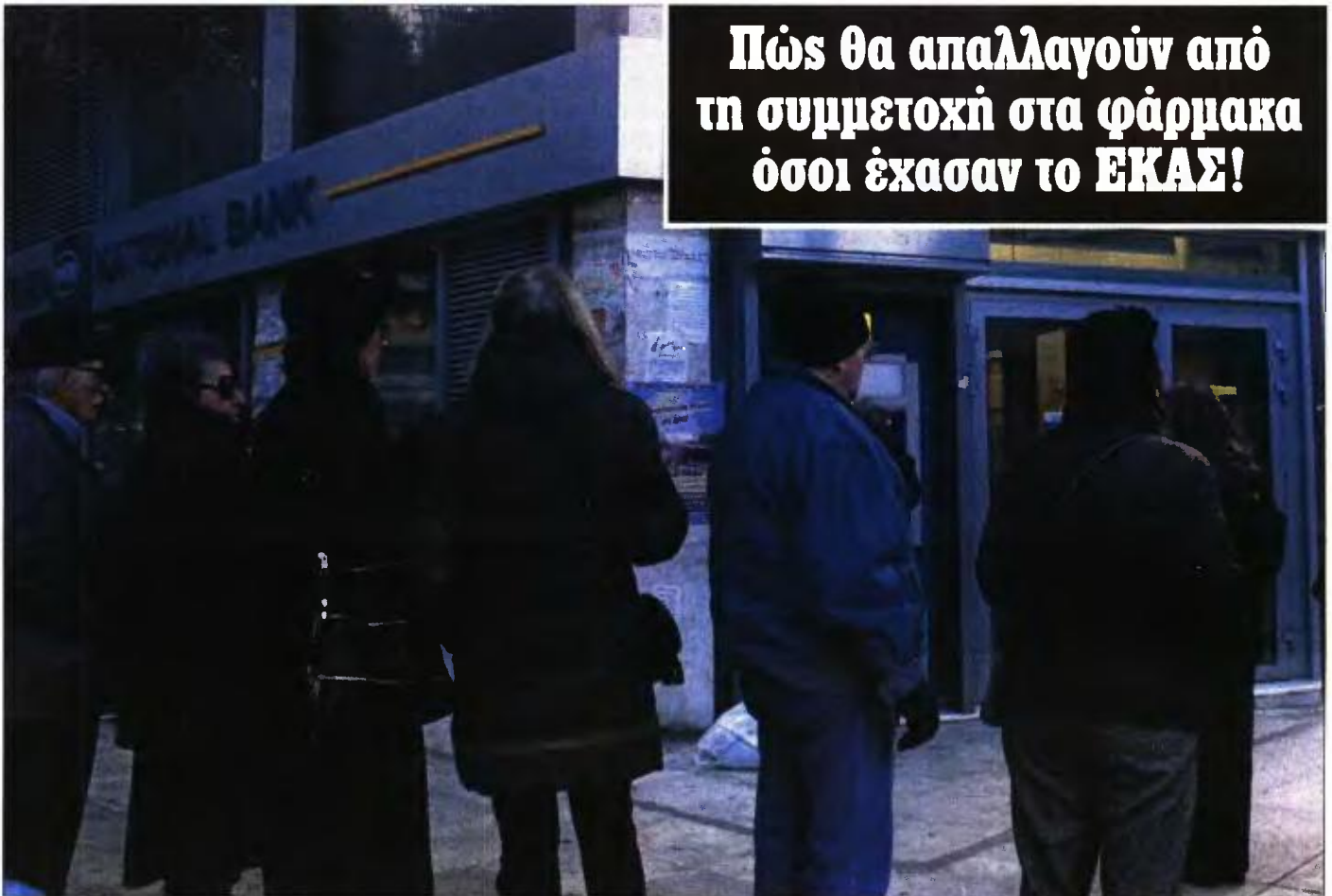
Συνταξιούχοι στην ουρά για το ΑΤΜ τράπεζας

ΤΑ ΔΙΚΑΙΟΛΟΓΗΤΙΚΑ που απαιτούνται για την απαλλαγή από την καταβολή συμμετοχής στη φαρμακευτική δαπάνη των ασφαλισμένων που έχασαν το ΕΚΑΣ έκανε γνωστά ο Εθνικός Οργανισμός Παροχής Υπηρεσιών Υγείας (ΕΟΠΥΥ). Συγκεκριμένα, τα παραστατικά που απαιτούνται προκειμένου να βεβαιώνεται ότι κάποιος συνταξιούχος είναι δικαιούχος ΕΚΑΣ (συμμετοχή στη φαρμακευτική δαπάνη 10%) ή είναι δικαιούχος μηδενικής συμμετοχής