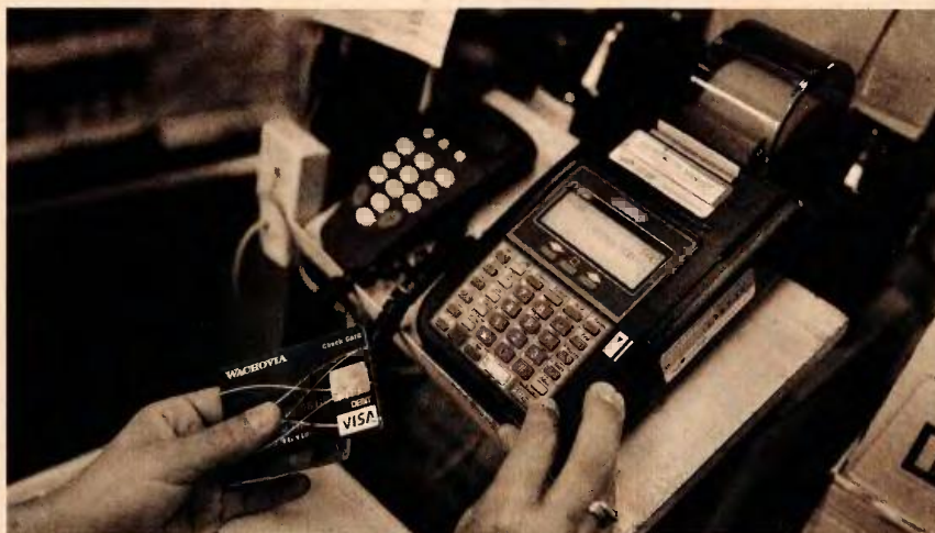
Από την υποχρέωση συλλογής αποδείξεων εξαιρούνται οι πολίτες με ηλικία άνω των 70 ετών και όσοι έχουν ποσοστό αναπηρίας 80% και άνω.

μέσων. Αν και ακόμα δεν έχει εκδοθεί η υπουργική απόφαση που θα καθορίζει τις αποδείξεις που θα «μετράνε» στην εφορία, σύμφωνα με πληροφορίες θα ισχύουν οι περισσότερες, καθώς είναι δύσκολο οι τράπεζες να απομονώσουν τις δαπάνες που γίνονται σε εξαιρούμενες και μη. Εκτός από τα ενοίκια και τις δόσεις στεγαστικών δανείων, το πιθανότερο σενάριο είναι να αναγνωρίζονται όλες οι υπόλοιπες. Οι φορολογούμενοι θα πρέπει