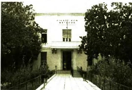
● Στο εδώλιο του Μονομελούς Πλημμελειοδικείου Βόλου θα καθίσει σήμερα ζευγάρι Ρομά, που κατηγορείται ότι εισέπραττε παράνομα επίδομα τρίτεκνων

Τις αιτήσεις χορήγησης πολυτεκνικών επιδομάτων τις κατέθεσαν τον Ιανουάριο του 2002, λίγο μετά την Πρωτοχρονιά και στις 30 Δεκεμβρίου 2009, παραμονή του νέου έτους, επέλεξαν δηλαδή εορταστικές περιόδους, προφανώς γνωρίζοντας τη χαλαρότητα των ημερών αυτών... Μάλιστα προσκόμιζαν βεβαιώ-