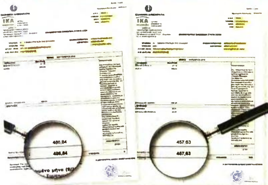
Στο εκκαθαριστικό πληρωμής αναπηρικής σύνταξης φαίνεται ότι η δικαιούχος εισέπραξε 486,94 ευρώ μέχρι και τη σύνταξη Σεπτεμβρίου 2016 και από τη σύνταξη Οκτωβρίου, που πληρώθηκε χθες, της επιβλήθηκε μείωση 6% με εισφορά ασθενείας, με αποτέλεσμα η σύνταξη της να μειωθεί από τα 486,94 στα 457,13 ευρώ.

ταν στο μικτό ποσό σύνταξης (προ μειώσεων) τώρα θα υπολογίζεται στο καταβαλλόμενο ποσό, δηλαδή αφαιρουμένων των μειώσεων.