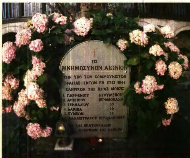
Η φωτογραφία της στήλης μνήμης από την Ιερά Μονή Αγίου Γεωργίου Φενεού Κορινθίας, όπου λειτούργησε από το ΚΚΕ ως Στρατιώτικο συγκεντρώσεως και εξοντώσεως τα έτη 1943-1944 και αμέτρητοι Έλληνες σφαγιασθηκαν. Ο Φενεός υπήρξε τόπος μαρτυρίου για εκατοντάδες Έλληνες από όλην την Πελοπόννησο. Τους άρπαξαν από την Μονή οι Αριστεροί δολοφόνοι και τους έσφαξαν σε γειτονικές καρβέρες. Ανάμεσα στους σφαγιασθέντες και οι Μοναχοί της Μονής.