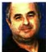
ΤΟΥ ΗΛΙΑ ΓΕΩΡΓΑΚΗ

Ο υπουργός Εργασίας Γιώργος Κατρούγκαλος αφού ολοκλήρωσε την προεκλογική δέσμευση για την επαναφορά της 13ης σύνταξης, επιμένει ότι «το 90% των εργαζομένων κερδίζουν από αυτή