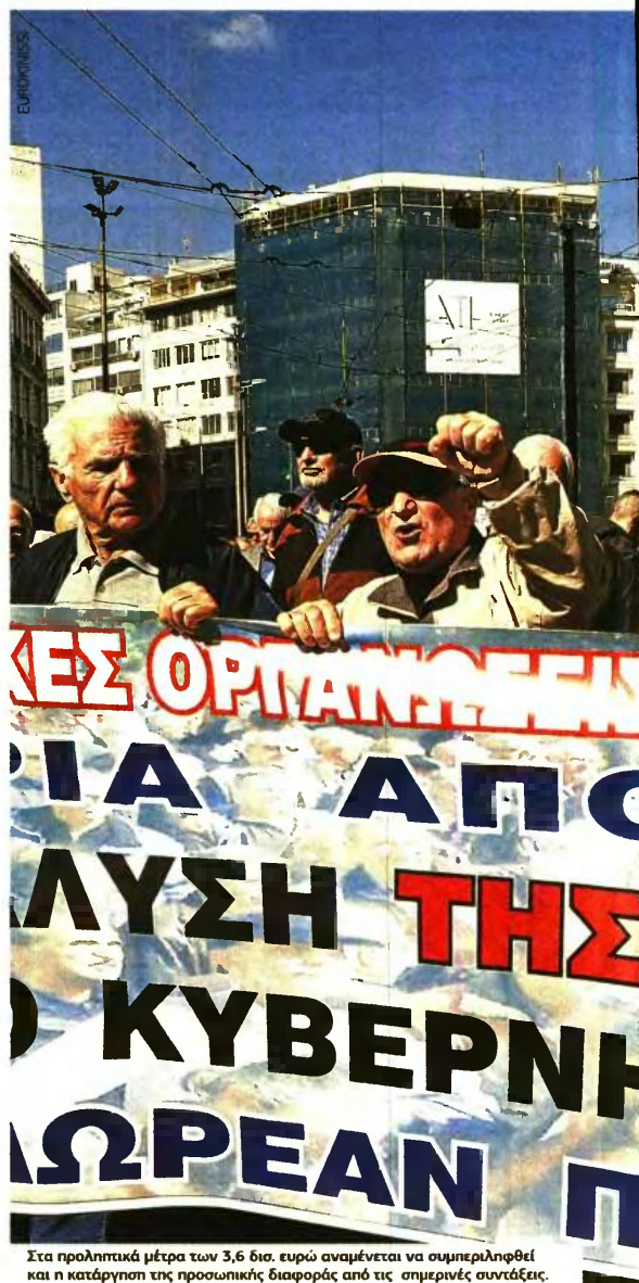
Στα προληπτικά μέτρα των 3,6 δισ. ευρώ αναμένεται να συμπεριληφθεί και η καταργηση της προσωπικής διαφοράς από τις σημερινές συντάξεις.