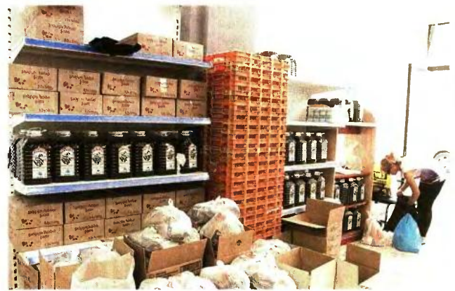
Ενίσχυση με τρόφιμα για 150 οικογένειες

«Δεν θα κάνουμε διανομή, σε οικογένειες καθώς θέλουμε να διασφαλίσουμε τα προσωπικά δεδομένα τους. Εικόνες με απλωμένα χέρια, σπρωξίματα κ.λπ. δεν θα δείτε στο χώρο του Υγειονομικού γιατί τα τρόφιμα θα δοθούν στους Συλλόγους για να τα μοιράσουν με διαφάνεια και ανάλογα με τις ανάγκες κάθε οικογένειας η οποία δεν χρειάζεται να γίνει θέμα για να εξασφαλίσει λίγο κρέας ή άλλα τρόφιμα. Κοινωνική αλληλεγγύη και αξιοπρέπεια, προσφορά και σεβασμός συνυπάρχουν.»