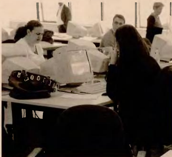
Στο σκέλος των εισφορών γίνεται λόγος από την ΟΚΕ για ρυθμίσεις που «καταδεικνύουν σύγκρουση μεταξύ εισφοράς - ασφάλισης και φόρου - πρόνοιας».

Δημοσιονομικού και εισπρακτικού χαρακτήρα είναι το νομοσχέδιο που κατέθεσε η κυβέρνηση στη Βουλή, σύμφωνα με την Οικονομική και Κοινωνική Επιτροπή (ΟΚΕ), η οποία ασκεί σκληρή κριτική στην επιχειρούμενη ασφαλιστική μεταρρύθμιση. Η ΟΚΕ εκτιμά ότι ενώ η επιβάρυνση σε συγκεκριμένες ομάδες ασφαλισμένων-φορολογουμένων φθάνει αθροιστικά το 55% με 56% του ακαθάριστου εισοδήματός τους, τα αποτελέσματά της θα είναι εξαιρετικά αμφίβολα και διατυπώνει οικονομικές, κοινωνικές αλλά και συνταγματικές ενστάσεις, αποδομώντας ακόμη και ιδεολογικά επιχειρήματα που χρησιμοποιεί ο υπουργός Εργασίας Γιώργος Κατρούγκαλος, όπως είναι ότι το νέο σύστημα λειτουργεί ως μηχανισμός αναδιανομής υπέρ των χαμηλών και μεσαίων στρωμάτων. Σύμφωνα με την Επιτροπή, μέτρα που εξομοιώνουν την κοινωνική ασφάλιση, ως μηχανισμό αναδιανομής, με τη φορολογία, δεν κάνουν τίποτε άλλο, παρά να αποδομούν τον θεσμό της κοινωνικής ασφάλισης, αντί να τον μεταρρυθμίζουν. Η ΟΚΕ επιστημαίνει εξ αρχής ότι απουσιάζουν οι αναγκαίες και απαιτούμενες αναλογιστικές μελέτες και υπογραμμίζει την ανάγκη να ληφθεί υπ' όψιν η νομολογία των