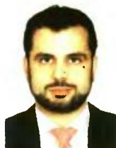
Γράφει ο Διονύσης Ρίζος

Φαίνεται λοιπόν πως ένα ένα «κλειδώνουν» μέτρα που θα αποφέρουν χρήματα στα Ταμεία του