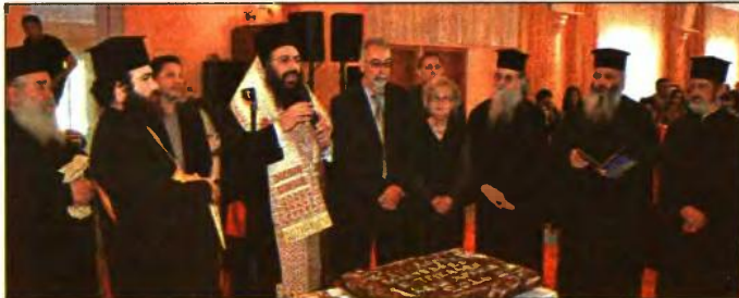
Από την προχθεινή εκδήλωση

Την πίτα ευλόγησε ο Σεβασμιότατος που έδωσε δημόσια εύσημα στους Πολύτεκνους για την κοινωνική τους προσφορά και για τον αγώνα που δίνουν υπό