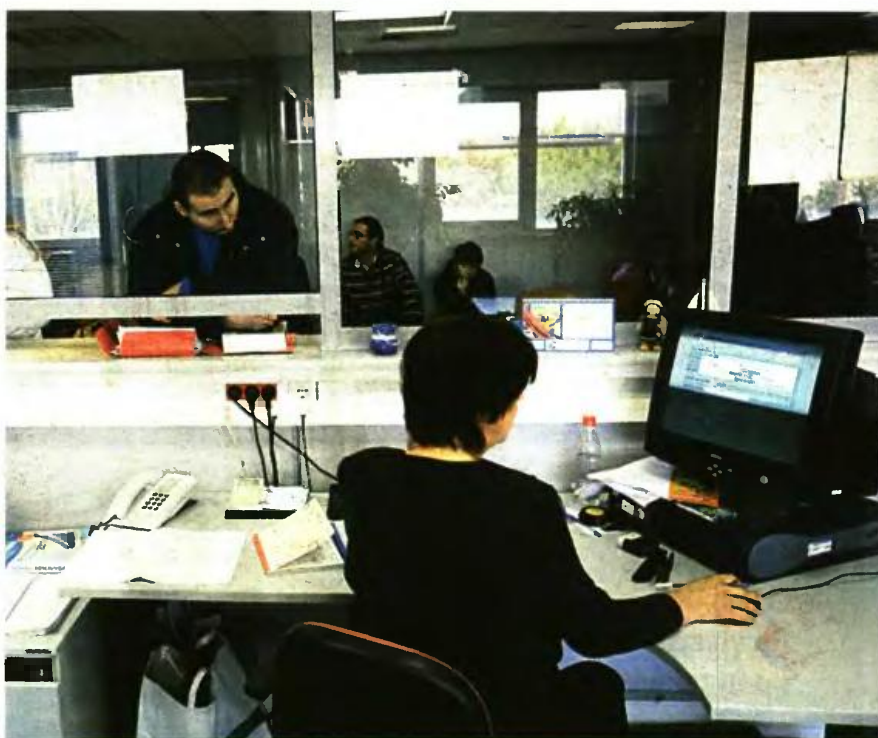
Μια σειρά διατάξεων που αφορά τα όρια ηλικίας έχει ήδη επηρεαστεί από τον νόμο που ψηφίστηκε το περασμένο καλοκαίρι

Με τα νέα όρια ηλικίας το όριο για την 35ετία είναι στα 60. Πλην όμως με εξαγορά της στρατιωτικής του θητείας θα συμπληρώσει τα 37 έτη το 2017, όταν το όριο ηλικίας θα είναι 57 ετών και 8 μηνών. Επομένως τότε θα μπορέσει να ανοίξει την πόρτα εξόδου και δεν θα χρειαστεί να κάνει περαιτέρω υπομονή για να πιάσει το 60ό έτος.