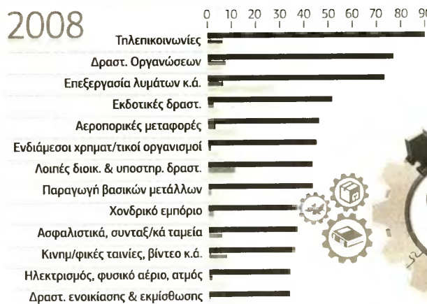
Παραγωγικότητα, μερική και προσωρινή απασχόληση στους κλάδους υψηλής παραγωγικότητας (2008 και 2014)

Στην πλειονότητά τους οι κλάδοι που αύξησαν την παραγωγικότητα τους εμφάνισαν είτε μείωση της μερικής