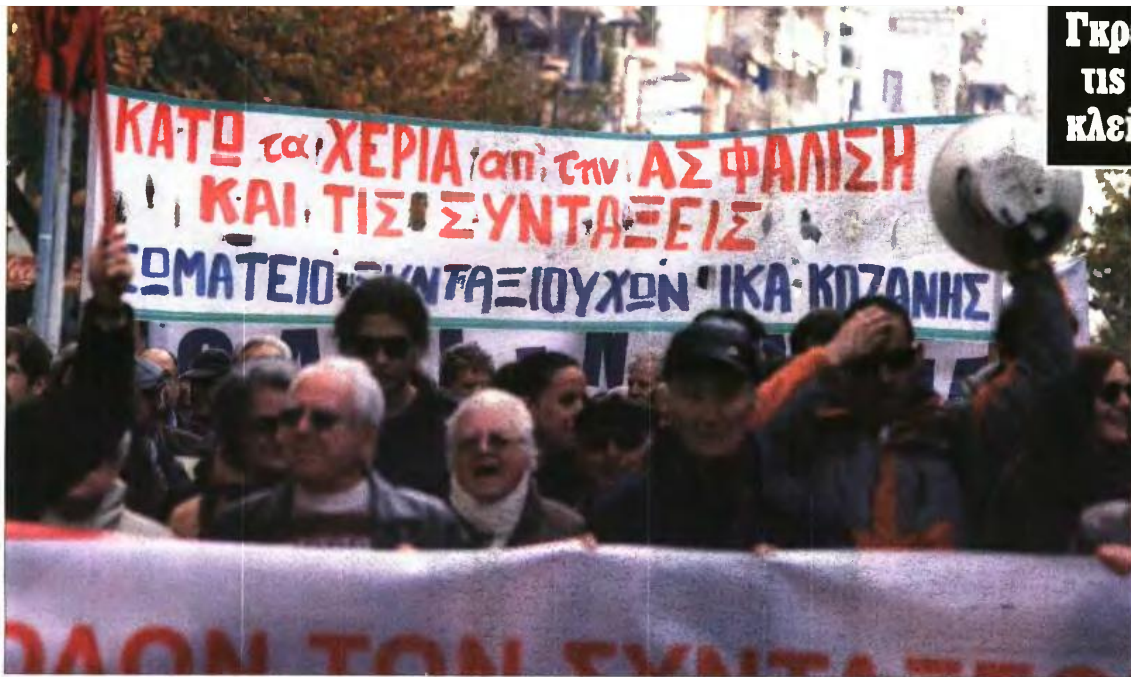
Συνταξιούχοι διαδηλώνουν στη Θεσσαλονίκη κατά των μνημονιακών περικοπών στις αποδοχές τους