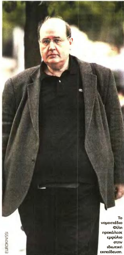
Το νομοσχέδιο Φίλιπ προκάλεσε εμφύλιο στην ιδιωτική εκπαίδευση.

Άρθρο 30 παράγραφος 2 του νομοσχεδίου αναφέρεται η συγκρότηση μίας τριμελούς επιτροπής (ένας σύμβουλος του ΙΕΠ, ένας εκπρόσωπος της ΟΙΕΛΕ και ένας εκπρόσωπος της αντιπροσωπευτικότερης εργοδοτικής οργάνωσης ιδιωτικών σχολείων), η οποία εξετάζει τη βιωσιμότητα του λόγου λύσης ενός εκπαιδευτικού.