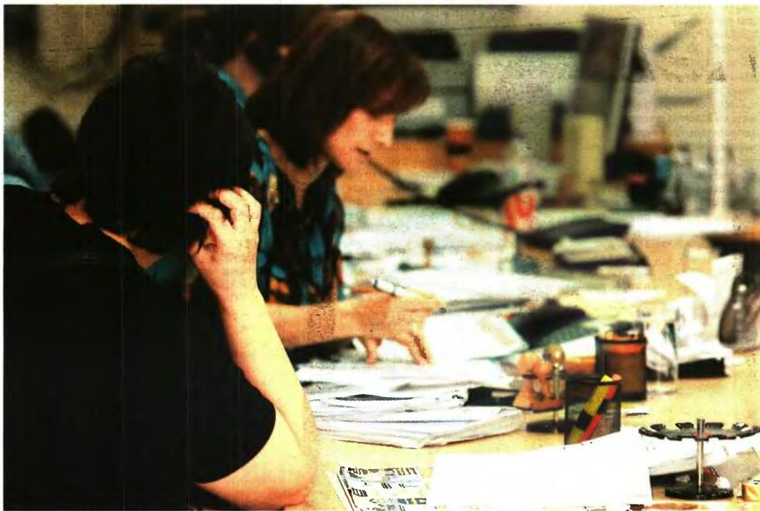
Καμία ευνοϊκή ρύθμιση δεν ισχύει για όσους ασφαλισμένους του δημόσιου και του ευρύτερου δημόσιου τομέα συμπληρώνουν τα έτη ασφάλισης μετά την 1η Ιανουαρίου 2013, καθώς ισχύει ενιαίο καθεστώς για όλους τους εργαζομένους

Σε όσες περιπτώσεις η ηλικία συνταξιοδότησης πάνεται μετά τις 18 Αυγούστου 2015 προβλέπεται σταδιακά μία αύξηση του ορίου, έως ότου κλείσουν τα παράθυρα