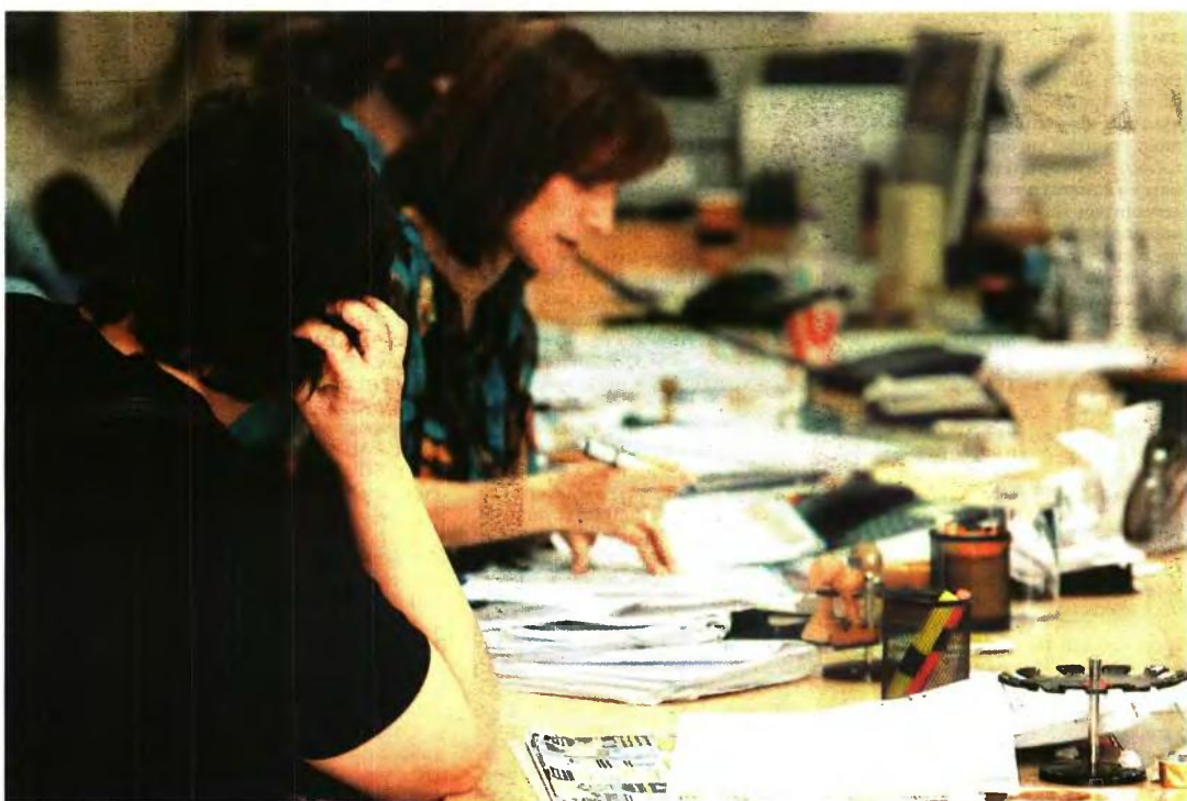
Καμία ευνοϊκή ρύθμιση δεν ισχύει για όσους ασφαλισμένους του δημόσιου και του ευρύτερου δημόσιου τομέα συμπληρώνουν τα έτη ασφάλισης μετά την 1η Ιανουαρίου 2013, καθώς ισχύει ενιαίο καθεστώς για όλους τους εργαζομένους

Σε όσες περιπτώσεις η ηλικία συνταξοδότησης πάνεται μετά τις 18 Αυγούστου 2015 προβλέπεται σταδιακά μία αύξηση του ορίου, έως ότου κλείσουν τα παράθυρα