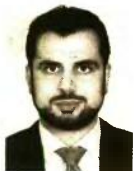
Γράφει ο Διονύσιος Ρίζος

Η διάταξη αναφέρει ότι ο υπολογισμός των εισφορών ξεκινά από την 1/6/2016, ενώ σήμερα ήδη γίνονται παρακρατήσεις με τον παλιό τρόπο από γραμμάτια προεισπραξίας και άλλες αμοιβές. Βεβαίως το μεγαλύτερο μπέρδεμα γίνεται με βάση τις εισφορές που θα κληθούν να καταβάλουν από την 1/1/2017 ελεύθεροι επαγγελματίες, αυτοαπασχολούμενοι και επιστήμονες, καθώς δεν έχει διευκρινιστεί ακόμη πώς και επί ποίων εισοδημάτων αυτές θα υπολογιστούν, ενώ σίγουρα αργεί ακόμη και τοποθετείται στο μέσον του 2017 η εκκαθάριση των εισοδημάτων του 2016. Όμως η μετακλίση του υπολογισμού των εισφορών στα εισοδήματα του 2015 δεν είναι καθόλου εύκολη υπόθεση καθώς αυτό δεν μπορεί να γίνει με εγκύκλιο ή ερμηνεία αλλά θα απαιτηθεί διάταξη που θα πρέπει να ζαναπεράσει από τη διαπραγματεύσει. Επιπρόσθετα σε θολό τοπίο βρίσκονται και όσοι επαγγελματίες έχουν περισσότερες από μια δραστηριότητες, καθώς δεν διευκρινίζεται αν το πλάρυν που έχει θεσπιστεί θα αφορά συνολικά τα εισοδήματα ή θα ισχύει ανά δραστηριότητα πολλαπλασιάζοντας έτσι την εισφοροδοτική υποχρέωση των ασφαλισμένων.