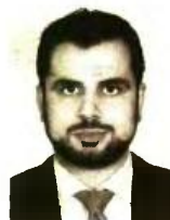
Γράφει ο Διονύσης Ρίζος

Σ ε στασιμότητα βρίσκονται πλέον τα θέματα που αφορούν τις τεχνικές διευθετήσεις του νέου ασφαλιστικού νόμου, του οποίου η εφαρμογή πρέπει να ξεκινήσει από την 1-1-2017. Μέχρι στιγμής δεν έχει ολοκληρωθεί καμιά από τις προκαταρκτικές ενέργειες ώστε να εκδοθούν ερμηνευτικές εγκύκλιοι επί των θεμάτων που εκκρεμούν αλλά ούτε και σχετικές τροπολογίες έχουν κατατεθεί για διορθώσεις που χρειάζονται σε αρκετές διατάξεις, ώστε να καταστεί ο νόμος λειτουργικός και να μην παρατηρούνται προβλήματα από την εφαρμογή του. Όπως για παράδειγμα συμβαίνει με τις κρατήσεις για τις επικουρικές συντάξεις των δικηγόρων και άλλων