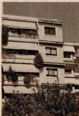
Η ρύθμιση των στεγαστικών δανείων θα ισχύσει αναδρομικά από την 1η Ιουλίου 2016.

Το ευνοϊκό πλαίσιο των ρυθμίσεων αφορά οφειλές 3,5 δις. ευρώ για 140.000 στεγαστικά ή επισκευαστικά δάνεια, ενώ, εκτός από τη δυνατότητα ευνοϊκής ρύθμισης για όσους αδυνατούν να ανταποκριθούν στη δόση του δανείου τους, το πλαίσιο προ-