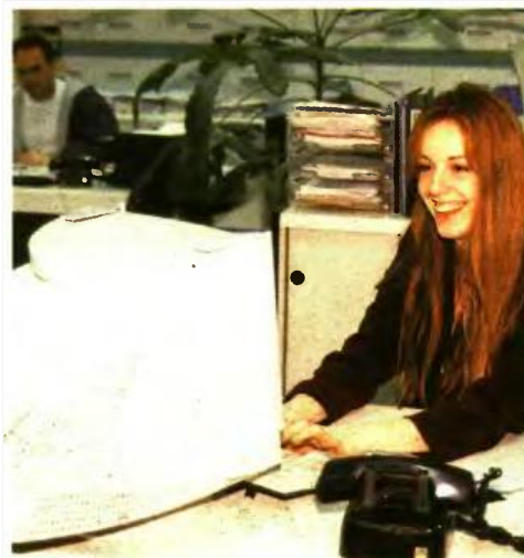
ΟΛΟΙ ΟΙ ΔΙΚΑΣΤΙΚΟΙ και οι δημόσιοι υπάλληλοι δικαιούνται 9μηνη άδεια ανατροφής