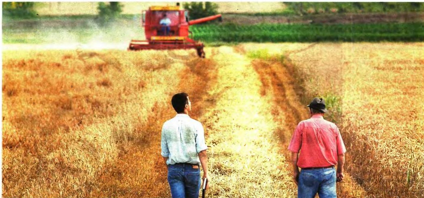
Μέχρι στιγμής το ΙΚΑ δεν «έμπαινε» στα χωράφια υποστηρίζοντας ότι η απασχόληση είναι θέμα του Οργανισμού Γεωργικών Ασφαλίσεων