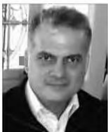
Από τον Αναστάσιο Λαυρέντζο

Σ τα τέλη του 2017 δημοσιεύτηκαν από την Ελληνική Στατιστική Αρχή τα στοιχεία τα οποία αποτυπώνουν τη δημογραφική εξέλιξη του ελληνικού πληθυσμού κατά την προηγούμενη χρονιά. Σύμφωνα με αυτά: