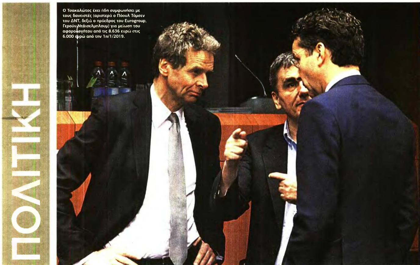
Ο Τσακαλώτος έχει ήδη συμφωνήσει με τους δανειστές (αριστερά ο Πόουλ Τόμσεν του ΔΝΤ, δεξιά ο πρόεδρος του Eurogroup, Γερούν Ντάισελμπλουμ) για μείωση του αφορολογήτου από τις 8.636 ευρώ στις 6.000 ευρώ από την 1η/1/2019.