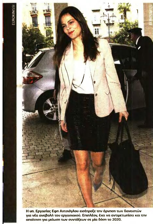
Η υπ. Εργασίας Εφη Ακτσιόγλου εισέπραξε την άρνηση των δανειστών για νέα αναβολή του εργασιακού. Επιπλέον, έχει να αντιμετωπίσει και την απαίτηση για μείωση των συντάξεων σε μία δόση το 2020.