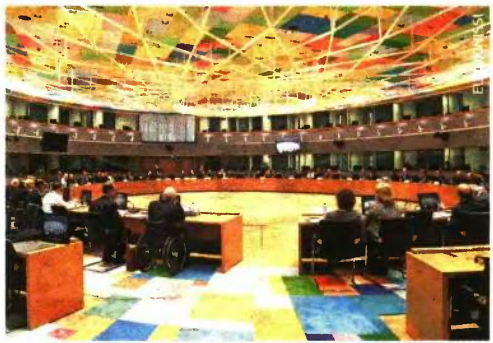
Σήμερα στο Eurogroup η Ελλάδα θα πρέπει να δεσμευτεί για κλείσιμο της αξιολόγησης χωρίς εκπτώσεις.

Αντίμετρα Τα ανταλλάγματα έχουν να κάνουν με τα αντίμετρα, δηλαδή το πού θα πιγαίνει το προϊόν ενδεχόμενης υπεραπόδοσης, όπου οι δανειστές θέλουν να διατίθενται σε δράσεις με προστιθέμενη αξία στην ανάπτυξη. Σε σχέση με τα εργασιακά, η κυβέρνηση επιδιώκει την επαναφορά των συλλογικών συμβάσεων και την επίτευξη ήπιας συμφωνίας για τις οριακές απολύσεις, ώστε να τα εμφανίσει ως επιτεύγματα της διαπραγμάτευσης. Οστόσο, στα δύο αυτά θέματα το ΔΝΤ παίζει το ρόλο του σκληρού εμποδίζοντας την εξερεύνηση κοινού τόπου, παρά την ευέλπκτη στάση των Ευρωπαίων. Συνεπώς, όσο παραμένουν ανοι-