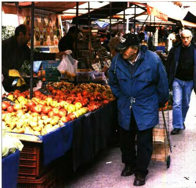
Καταναλωτές στη λαϊκή του Ζωγράφου

Σε δεινή κατάσταση έχουν περιέλθει, όπως λένε, και οι παραγωγοί που βλέπουν τους καταναλωτές να σκύβουν πάνω από τους πάγκους και να ψωνίζουν... με τα μάτια. «Οι πελάτες μας είναι κυ-