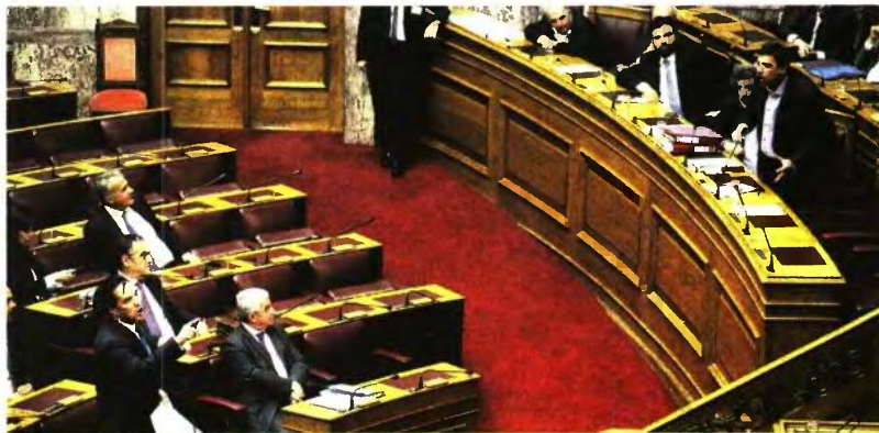
Υψηλοί τόνοι επικράτησαν χθες στη Βουλή ενώ έντονη ήταν η αντιπαράθεση μεταξύ της ηγεσίας του υπουργείου Υγείας (Ξανθός, Πολάκης) και του αντιπροέδρου της Ν.Δ. Αδ. Γεωργιάδη .

Το «καμένο τετράμηνο» λόγω των καθυστερήσεων στη δεύτερη αξιολόγηση έχει καταστήσει ανέφικτη την επίτευξη του στόχου για ανάπτυξη 2,7% το 2017