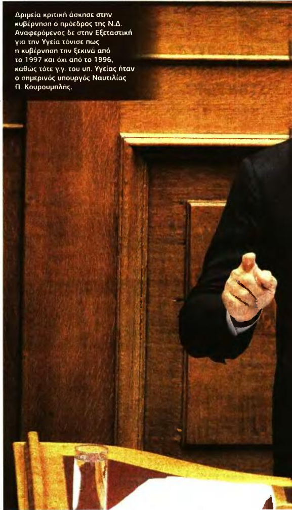
Δριμεία κριτική άσκησε στην κυβέρνηση ο πρόεδρος της Ν.Δ. Αναφερόμενος δε στην Εξεταστική για την Υγεία τόνισε πως η κυβέρνηση την ξεκινά από το 1997 και όχι από το 1996, καθώς τότε γ.γ. του υπ. Υγείας ήταν ο σημερινός υπουργός Ναυτιλίας Π. Κουρουμπλής.

«Βουλιάξατε τη χώρα» Ο πρόεδρος της Ν.Δ. Κυριάκος Μητσοτάκης χαρακτήρισε τη συγκυβέρνηση ΣΥΡΙΖΑ-ΑΝ.ΕΛ. «φαρσοκωμωδία» και το μόνο που θέλετε «είναι να μείνετε στην εξουσία με κάθε τρόπο, με κάθε κόστος, με κάθε μέσο, όσο γίνεται περισσότερο... Βουλιάξατε την οικονομία, βουλιάξατε τη χώρα. Και αντί να