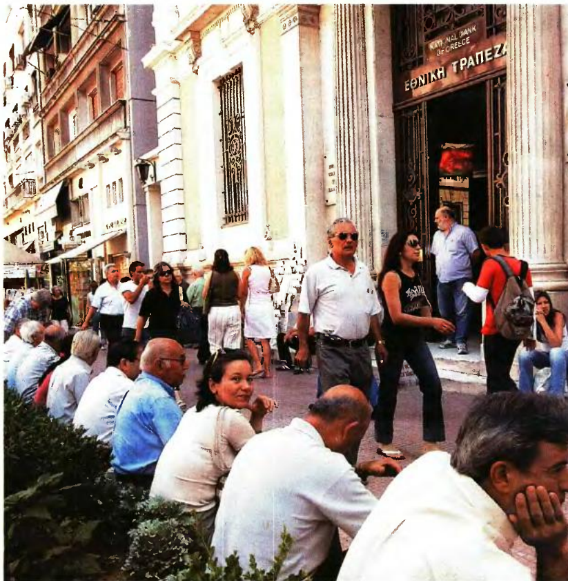
Εξοικονόμηση περίπου 1,62 δισ. ευρώ θα προκύψει, σύμφωνα με τους πρώτους υπολογισμούς, από τις περικοπές των κύριων συντάξεων

► Στις κύριες συντάξεις το «ψαλίδι» στην προσωπική διαφορά οδηγεί σε απώλειες έως και 22%