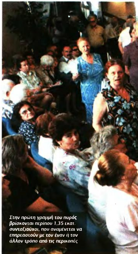
Στην πρώτη γραμμή του πυρός βρίσκονται περίπου 1,35 εκατ. συνταξιούχοι, που αναμένεται να επηρεαστούν με τον έναν ή τον άλλον τρόπο από τις περικοπές

Οι περικοπές Από όλους όσοι μπαίνουν στο φάσμα των περικοπών, περίπου 450.000 θα υποστούν και το μεγαλύτερο «μαχαίρι» στην προσωπική διαφορά, απορροφώντας όλη τη μείωση του 18%. Μεταξύ αυτών είναι: ■ Δημοσίοι υπάλληλοι με 30 και άνω έτη υπηρεσίας (ένστολοι, γιατροί κ.ά.). ■ Συνταξιούχοι από το πρώην ΤΕΒΕ. ■ Μητέρες ανήλικων που έχουν συνταξιοδοτηθεί από το ΙΚΑ, όπως και άλλοι συνταξιούχοι ΙΚΑ με αρκετά υψηλές αποδοχές και άνω των 30 ετών ασφαλίτη. ■ Συνταξιούχοι νομικοί, μηχανικοί, γιατροί, φαρμακοποιοί. ■ Διπλοσυνταξιούχοι. Μικρότερες, αλλά αισθητές μειώσεις θα έχουν όσοι συνταξιοδοτήθηκαν με λίγα χρόνια ασφαλίτη και η σύνταξη τους ανανεμήθηκε με τα καλύτερα όρια και τις προσαυξήσεις τους, τόσο από το ΙΚΑ όσο και από άλλα Ταμεία κυρίως μισθωτών. «Πέραν της συρρίκνωσης ή πλήρους περικοπής της προσωπικής διαφοράς, σε απομείωση του συνταξιοδοτικού εισοδήματος θα οδηγηθεί και η περικοπή των οικογενειακών επιδομάτων (γάμου/τέκνων) σημει-