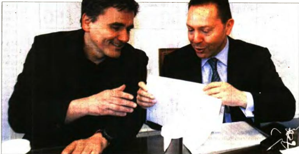
Ο υπουργός Οικονομικών Ε. Τσακαλώτος με τον κεντρικό τραπεζίτη Γ. Στουρνάρα

Ο σο τρελό κι αν ακούγεται, η ιδιόρρυθμη Αριστερά που μας κυβερνά έχει δικούς της λόγους να θέλει τη φορολογική μέγερνη που επιβάλλει το Βερολίνο. Οι ακροαριστεροί επιθυμούν τη συντριβή της μεσοκίας τάξης και των ελεύθερων επαγγελματιών, διότι έτσι η κοινωνία θα μετασχηματιστεί σε αυτό που ονειρεύονται : από πάνω τα στελέχη του κόμματος - κυβερνήσης και από κάτω το πλήθος των νεοπρολετάρων με συντάξεις και μισθούς πείνας. Όσο πιο πολλοί εξαρτημένοι από την κοινωνική πρόνοια τόσο καλύτερα.