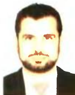
Γράφει ο Διονύσης Ρίζος

Είναι η πρώτη φορά που θα επηρεαστούν ακόμη και συνταξιούχοι των