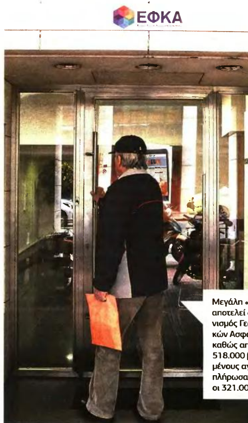
Μεγάλη «πληγή» αποτελεί ο Οργανισμός Γεωργικών Ασφαλίσεων, καθώς από τους 518.000 βεβαιωμένους αγρότες, πλήρωσαν μόλις οι 321.000

Από την πλευρά τους, υπηρεσιακά στελέχη του ΕΦΚΑ υπογραμμίζουν στην «ΕΛΕΥΘΕΡΙΑ του Τύπου» ότι οι δραματικές καθυστερήσεις του κλεισίματος της 2ης αξιολόγησης, αλλά και οι υποσχέσεις της πολιτικής ηγεσίας του υπουργείου Εργασίας για νέες ρυθμίσεις ναρκοθετούν οποιαδήποτε προσπάθεια για τη βελτίωση των εσόδων. Πάντως χθες ο ΕΦΚΑ ανήρτησε στις ηλεκτρονικές υπηρεσίες του τις εισφορές Απριλίου 2017 των αγροτών, των αυτοαπασχολούμενων και των ελεύθερων επαγγελματιών, ανακοινώνοντας παράλληλα ότι η καταληκτική ημερομηνία καταβολής είναι η Τετάρτη 31 Μαΐου 2017.