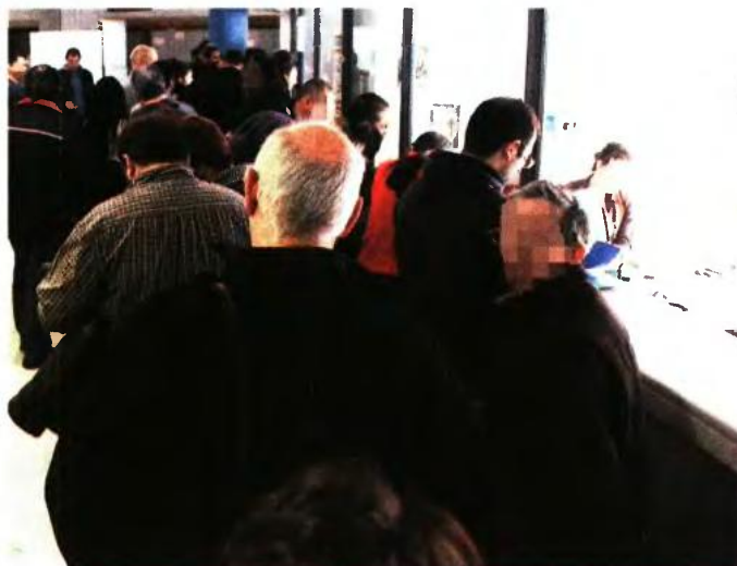
Για το 2018 η βάση υπολογισμού των ασφαλιστικών εισφορών θα είναι έσοδα μείον δαπάνες (εκτός εισφορών), μείον 15% επί του συνόλου. Προσοχή, από τη βάση υπολογισμού δεν θα αφαιρούνται οι ασφαλιστικές εισφορές του προηγούμενου έτους

Προσοχή, καθώς από την 1-1-2019 κάνεται η έκπτωσης και η επιβάρυνση μεγαλύτερη. Για τους ελεύθερους επαγγελματίες του πρ. ΟΑΕΕ μπορεί να αγγίξει και το 28% συγκριτικά με το 10% που πληρώναν βάσει του σημερινού συστήματος. Ειδικότερα οι αυξήσεις υπολογίζονται από 4,6% έως και 27,95%, ενώ στις περισσότερες περιπτώσεις είναι άνω του 25%, πάντα με την παραδοχή πως το εισόδημα παραμένει σταθερό. Για το 2018 οι επιβαρύνσεις μετριάζονται στο 5% έως 14%. Διασώζονται όσοι έχουν κέρδη άνω των 85.000 ευρώ λόγω του ότι υπερβαίνουν ήδη το ανώτατο όριο. Ειδικά για τους αυτο-