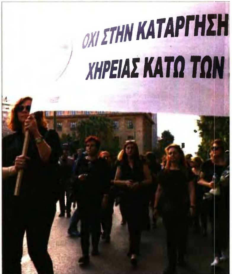
Χήρες στρατιωτικών, ναυτικών, γιατρών, οικοδόμων, βιοτεχνών και ιδιωτικών υπαλλήλων απέναντι στη Βουλή

Αν στη λήξη της τριετίας δεν έχουν συμπληρώσει το 55ο έτος της ηλικίας τους, καλούνται να βγουν στην αγορά εργασίας, ενώ, αν έχουν γίνει 55 ετών, δικαιούνται ξανά σύνταξη χρείας, αλλά μετά τα 67. «Εχασα πρόσφατα τον σύζυγό μου, για-