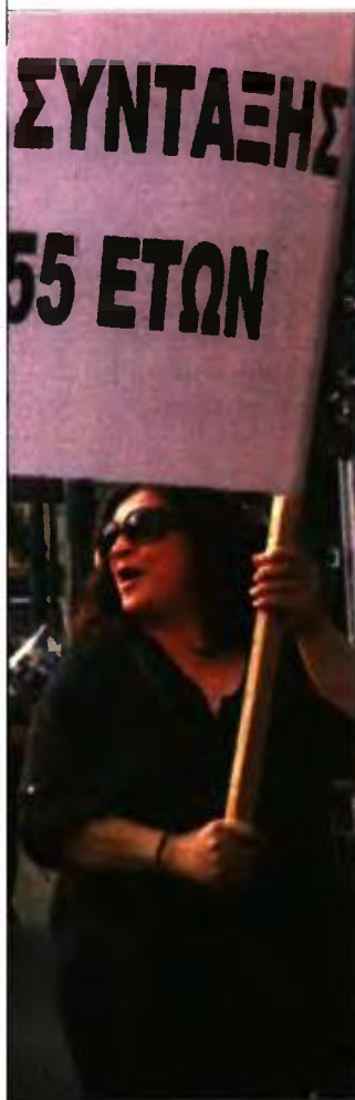
Έκαναν χθες πορεία διαμαρτυρίας.