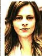
Η υπουργός Εργασίας Εφη Ακτσιόγλου. Το υπουργείο επεξεργαζόταν εδώ και καιρό λύση στο ζήτημα που έχει ανακύψει με τις επικουρικές συντάξεις.