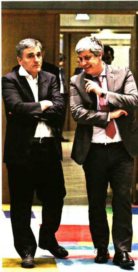
Σαφές το μήνυμα του Μάριο Σεντένο: «Η Ελλάδα θα επανακτήσει τον έλεγχο των πολιτικών της. Θα έχει περισσότερη ευελιξία κι αυτό θα αντανακλά περισσότερες επιλογές για τα κόμματα και τον ελληνικό λαό». Στη φωτογραφία ο πρόεδρος του Eurogroup με τον υπουργό Οικονομικών, Ευκλείδη Τσακαλώτο

Σύμφωνα με πληροφορίες από κυβερνητικές πηγές, το κείμενο θα αποσταλεί ολοκληρωμένο στην Κομισιόν και τα θεσμικά όργανα της Ευρωζώνης εντός της εβδομάδας. Προς το παρόν, επισημαίνουν στελέχη του οικονομικού επιτελείου, δεν υπάρχει καμία επίσημη αντίδραση από τους δανειστές και, ασφαλώς, καμία ένδειξη περί των «ενστάσεων» που αναφέρονται στον Τύπο, υπογραμμίζουν με νόημα.