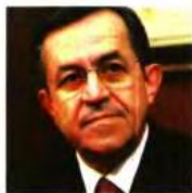
Του Νίκου Ι. Νικολόπουλου ανεξαρτήτου βουλευτή και προέδρου του Χριστιανοδημοκρατικού Κόμματος

• Η κατάρρευση των ελαχίστων δημογραφικών κινήτρων που είχαν απομείνει και που αποτελούσαν ένα ανάχωμα στον κατήφορο της υπογεννητικότητας, οδηγεί πλέον την Ελλάδα μπροστά στην