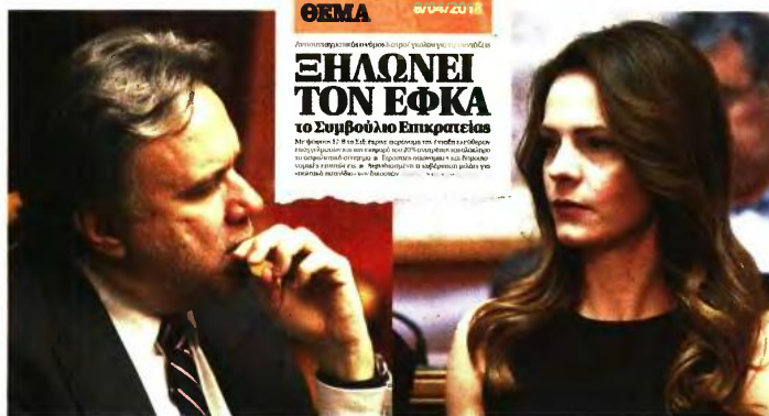
Η υπουργός Εργασίας Εφη Ακτσιόγλου έχει ενημερωθεί εδώ και δύο μήνες για την τύχη του νόμου Κατρούγκαλου

όπου κρίθηκε αντισυνταγματικός. Ήδη έχουν προγραμματιστεί δύο ακόμη διασκέψεις της Ολομέλειας. Η μία για την τρέχουσα εβδομάδα και η άλλη στην εκπονή του μήνα. Δεν αποκλείεται, όμως, αν κριθεί αναγκαίο, να υπάρξει και άλλη ή ακόμα και άλλες διασκέψεις. Η δημοσίευση της απόφασης αναμένεται μέχρι το καλοκαίρι.