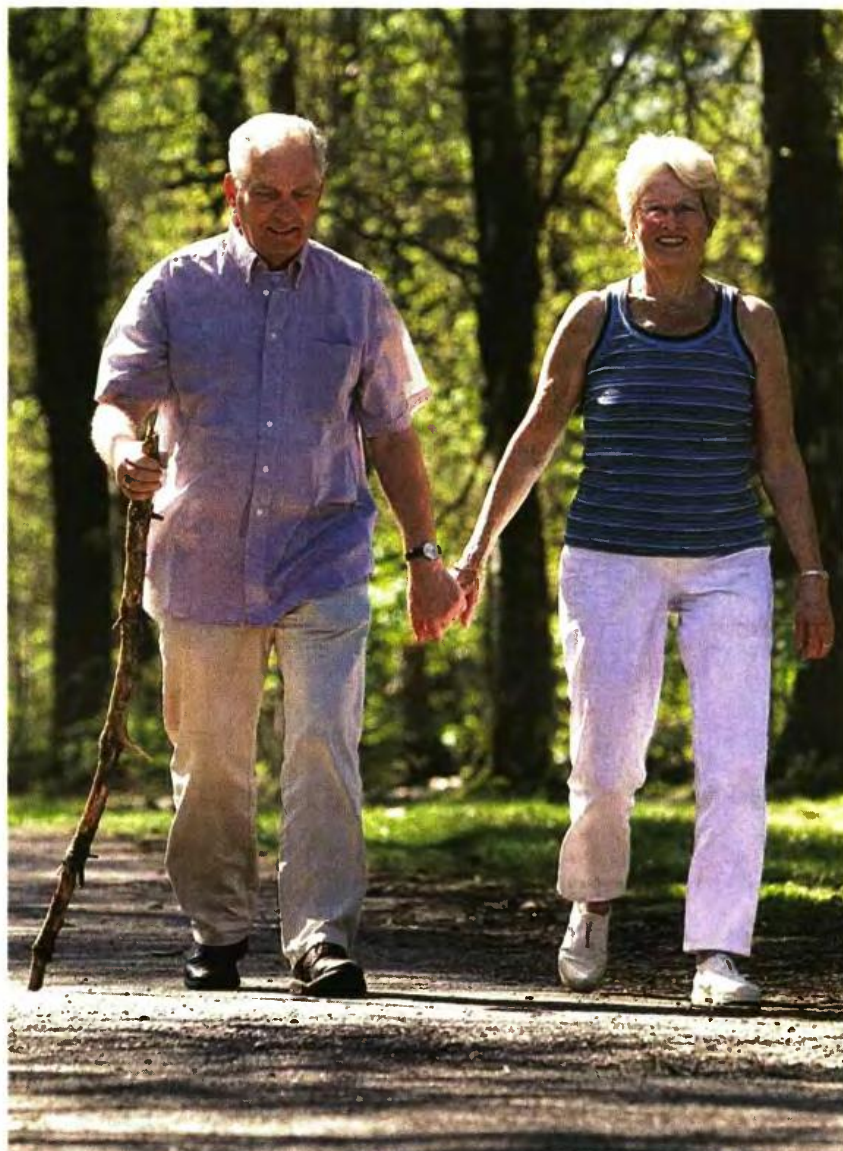
Με βάση τις προβλέψεις του Διεθνούς Νομισματικού Ταμείου για την Ελλάδα, το 2035 το 27,2% των πολιτών θα είναι άνω των 65 ετών, όταν το 2015 αντιστοιχούσε στο 20,1%.

Καρνανάκι χτυπά το ΔΝΤ για την Ελλάδα, καθώς τα στοιχεία δείχνουν ότι το 2035 ο πληθυσμός της χώρας θα έχει υψηλό μέσο όρο ηλικίας. Αυτό θα έχει επίπτωση τόσο στην παραγωγικότητα όσο και στο συνταξιοδοτικό σύστημα.