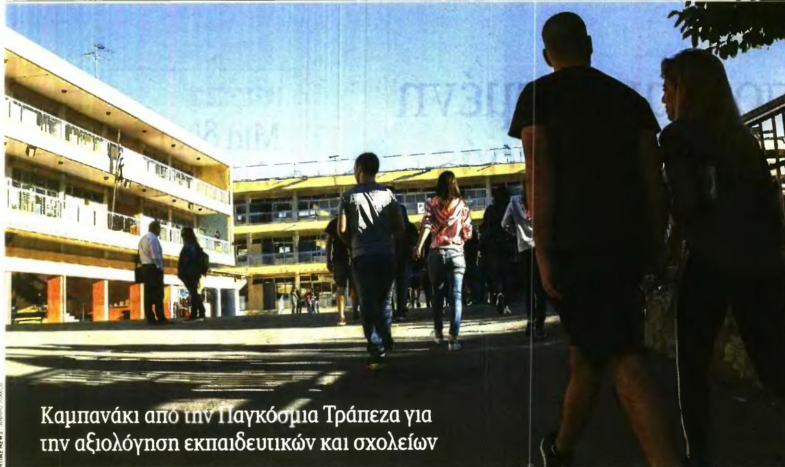
Καμπανάκι από την Παγκόσμια Τράπεζα για την αξιολόγηση εκπαιδευτικών και σχολείων