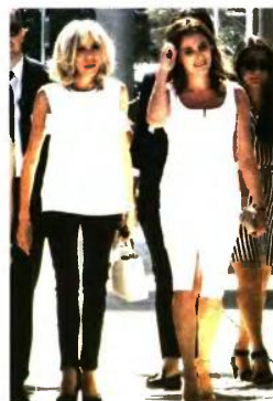
Η Μπέτου Μπαζιάνα (στη φωτογραφία με τη σύζυγο του Εμμανουήλ Μακρόν Μπριζιτ Τρονιέ) κατάφερε να προσαρμοστεί στις απαιτήσεις του ρόλου της

τους ήταν ένα στοιχείο αδιανόητο, δεν ήξεραν πώς να το αντιμετωπίσουν. Υπερα από τρία χρόνια στη διακυβέρνηση της χώρας, το να δίνει ραντεβού στους δρόμους της αντίστασης, μία εβδομάδα προτού ο σύντροφός σου εισαγάγει στη Βουλή τα σκληρά αντιλαϊκά μέτρα των πλειστηριασμών, του περιορισμού στο δικαίωμα της απεργίας, της περικοπής πολιτικών επιδομάτων, τα οποία σαρώνουν και το τελευταίο ψήγμα αριστεροσύνης της κυβέρνησης, σημαίνει ότι αρνείσαι τα μαθήματα της ζωής. Αν αρνείσαι για αλαζονεία, για δογματισμό ή για ένα κόλπο του επικοινωνιακού επιτελείου του Μεγάρου Μαξίμου προκειμένου να επικοινωνήσει ξανά με το αριστερό ακροατήριο, ακόμα και με το ΚΚΕ, είναι άνοστο.