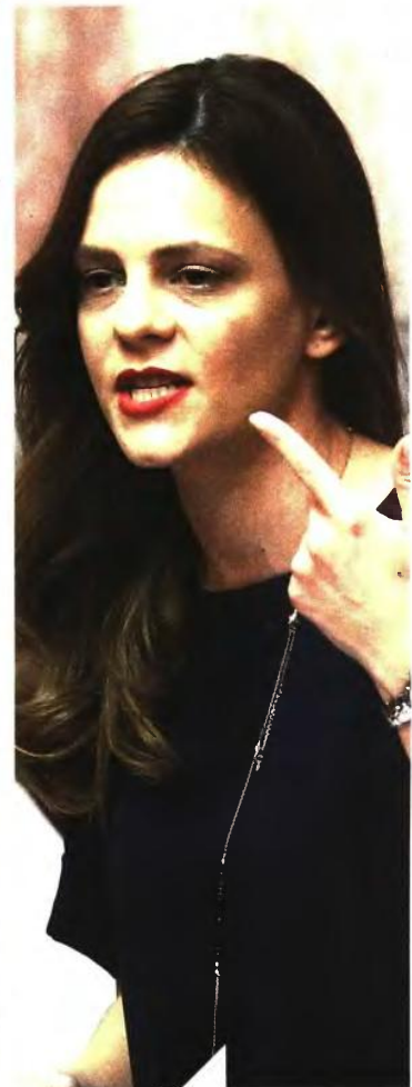
Ο υπουργός Οικονομικών Ευκλείδης Τσακαλώτος και η υπουργός Εργασίας Εφρ Ακτσιόγλου

Ως κυματοθραύστια του κυβερνητικού λιμανιού απέναντι στη μοιρολόρα των βουλευτών του ΣΥΡΙΖΑ θα λειτουργήσει η ομιλία του ίδιου του πρωθυπουργού. Ο κ. Τσίπρας αναμένεται να επιτεθεί με σφοδρότητα στη Νέα Δημοκρατία προκειμένου να συσπειρώσει την κοινοβουλευτική του ομάδα και να περιγράψει ξανά το επόμενο εξάμηνο ως τον δρόμο εξόδου της χώρας από τα μνημόνια.