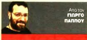
Από τον ΓΙΩΡΓΟ ΠΑΠΠΟΥ

Τα δεσμευμένα ακίνητα θα «αλλάζουν χέρια» από τις 21 Φεβρουαρίου μόνο ηλεκτρονικά.