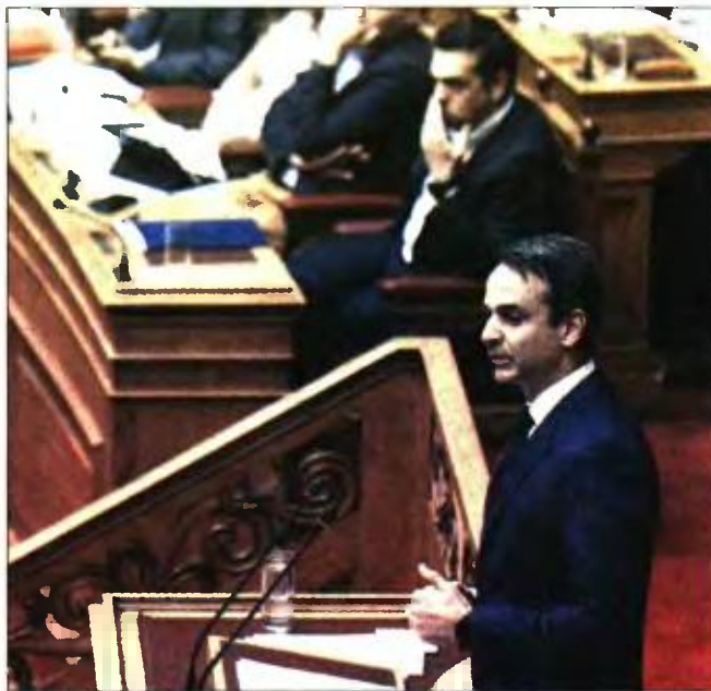
Αλέξης Τσίπρας και Κυριάκος Μητσοτάκης σε παλαιότερη συζήτηση πολιτικών αρχηγών στη Βουλή

Σε κλίμα σφοδρής αντιπαράθεσης αναμένεται να διεξαχθεί η συζήτηση των πολιτικών αρχηγών. Τι επιδιώκουν το Μαξίμου και η αντιπολίτευση