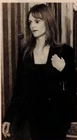
Η νέα υπουργός Εφη Αχτσιόγλου καλείται να διαμορφώσει την ελληνική διαπραγματευτική γραμμή έναντι των πιστωτών.

σον προβλέπονται καλύτεροι όροι. Ολόκληρη η διαπραγματευτική γραμμή της ελληνικής κυβέρνησης στήνεται, σύμφωνα με πληροφορίες, γύρω από τον σεβασμό των αποφάσεων των ελληνικών δικαστηρίων και κατά δεύτερο λόγο των διεθνών συμβάσεων, προκειμένου να ανακαιτιστεί η πίεση για τον ΟΜΕΔ αλλά και τους μισθούς των νέων. Στο θέμα των ομαδικών απολύσεων, δεν αποκλείεται η αποδοχή – υπό προϋποθέσεις – της πρότασης των «Σοφών» για μειωμένο (όχι όμως και μηδενικό) ωράριο σε εργαζομένους που κινδυνεύουν και ήδη εξετάζεται η δυνατότητα μερικής επιδότησης του μειωμένου ωραρίου, σε περίπτωση που υπάρχει η σύμφωνη γνώμη του συνδικάτου της επιχείρησης. Σημείο... ισορροπίας αναζητείται από την ελληνική πλευρά για το θέμα του κατώτατου μισθού, με τους δανειστές να επιμένουν ότι