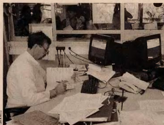
Η ΓΓΔΕ ζητεί την αποστολή εντολών ελέγχου σε όσους εμπλέκονται σε σοβαρές υποθέσεις, έτσι ώστε να αποφευχθεί το ενδεχόμενο παραγραφής τους.

Πάντως, το θέμα των παραγραφών χρήσεων απασχολεί ιδιαίτερα