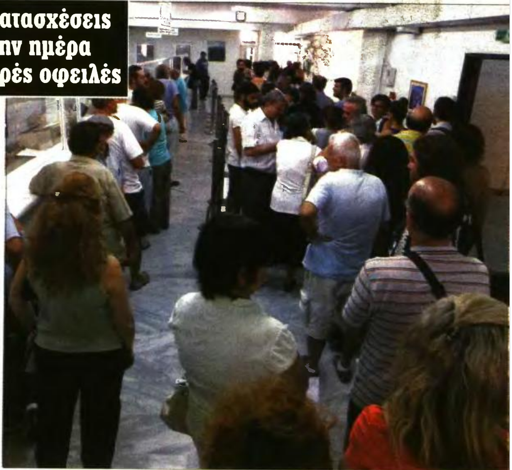
Πολίτες περιμένουν στην ουρά εφορίας