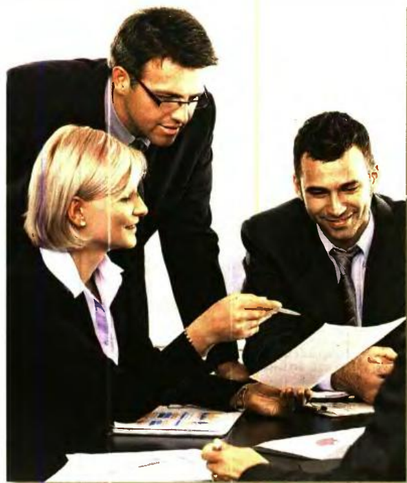
Σύνταξη από το ΙΚΑ πριν από τα 62

συνταξιοδοτούνται με πλήρη ή μειωμένη σύνταξη και με το όριο ηλικίας που ισχύει τη χρονιά που συμπληρώνουν τις 10.500 ημέρες, εκ των οποίων οι 7.500 στα βαρέα. Παράδειγμα: Ασφαλισμένος που το 2015 έχει 10.500 ημέρες ασφάλισης, εκ των οποίων 7.500 τουλάχιστον στα βαρέα και ανθυγιεινά επαγγέλματα, δικαιούται πλήρη σύνταξη, όταν γίνει 62 και μειωμένη στα 60. ■