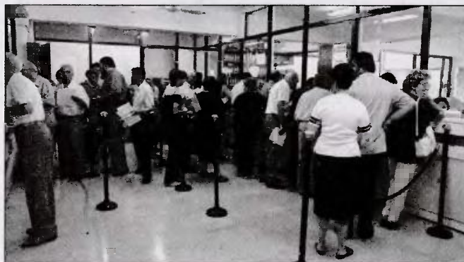
Σε καθημερινή βάση τα δικαστικά τμήματα των εφοριών στέλνουν στις τράπεζες τουλάχιστον 1.200 ηλεκτρονικά κατασχετήρια τραπεζικών λογαριασμών

Η διαδικασία της κατάσχεσης γίνεται ως εξής: από τη στιγμή που η εφορία διαπιστώσει ότι ένας φορολογούμενος δεν πληρώνει τη δόση του για πάνω από τρεις μήνες η ρύθμιση στην οποία έχει υπαχθεί ακυρώνεται και ξεκινάει η διαδικασία δέσμευσης λογαριασμών. Τα δικαστικά τμήματα των ΔΟΥ αποστέλλουν ηλεκτρονικά κατασχετήρια σε όλες τις τράπεζες με την εντολή να δεσμευτούν τραπεζικές καταθέσεις μέχρι του οφειλόμενου ποσού, με την προϋπόθεση βέβαια ότι στον λογαριασμό υπάρχουν καταθέσεις. Η κάθε τράπεζα είναι υποχρεωμένη αυτομά-