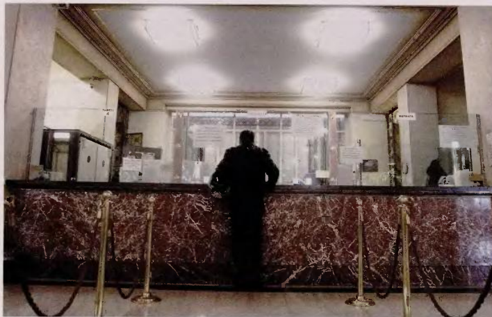
Σύμφωνα με τραπεζικά στελέχη, μετά το 2011 έχουν χορηγηθεί στεγαστικά δάνεια ύψους περίπου 1,5 δισ. ευρώ, καταναλωτικά δάνεια 2,5 δισ. ευρώ και δάνεια προς μικρομεσαίες επιχειρήσεις ύψους 500 εκατ. ευρώ.

Τα νέα δάνεια μπορεί να εμφανίζουν εντυπωσιακά χαμηλά ποσοστά καθυστερήσεων, ωστόσο δεν αποτελούν παρά σταγόνα στο συνολικό χαρτοφυλάκιο δανείων. Σύμφωνα με τραπεζικά στελέχη, μετά το 2011, έχουν χορηγηθεί στεγαστικά δάνεια ύψους περίπου 1,5 δισ. ευρώ, καταναλωτικά δάνεια ύψους 2,5 δισ. ευρώ και δάνεια προς μικρομεσαίες επιχειρήσεις ύψους 500 εκατ. ευρώ. Τα «νέα»