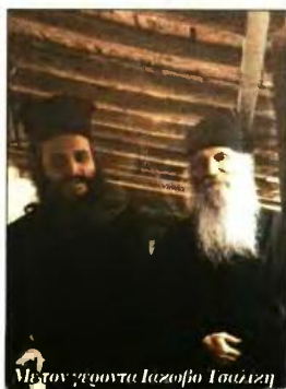
Με τον γέροντα Ιακώβo Τσαλκίo

Ολοκληρώνοντας την επικοινωνία μας, δεν παραλείπει να αναφερθεί στην προσφορά του Αρχιεπισκόπου Αθηνών κ. Ιεροσώνιμου για τους πολυτέκνους. «Δείχνει μεγάλο ενδιαφέρον και για τους οικογενειάρχες. Αλλά και ο λόγος του είναι ουσιαστικός και καίριος. Είναι ένας ασπός και ταπεινός άνθρωπος, που με το παράδειγμά του εμπνέει και μας καθοδηγεί», τονίζει χαρακτηριστικά.