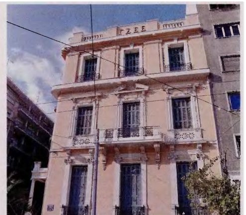
Η ΓΣΕΕ επισμαίνει ότι η παύση των πληρωμών ξεκινά, όπως ορίζει το δικαστήριο, με τη δημοσίευση της απόφασης πτώχευσης της επιχείρησης.

υφίσταται πτωχευτική περιουσία, η σειρά κατάταξης διαμορφώνεται ως εξής: Πρώτα ικανοποιούνται οι απαιτήσεις των δανειστών της πτωχής για τις οποίες υπάρχει ενέχυρο ή υποθήκη ή προσημείωση υποθήκης. Εφόσον πρόκειται για ακίνητο ικανοποιούνται κατά τα 2/3 οι απαιτήσεις των δανειστών και κατά το 1/3 οι εργατικές απαιτήσεις μαζί με τις απαιτήσεις του Δημοσίου και των λοιπών φορέων κοινωνικής ασφάλισης. Παράλληλα, επισμαίνεται ότι εφόσον οφείλονται στους εργαζομένους αποδοχές μέχρι 3 μηνών, οι οποίες εμπίπτουν στο χρονικό διάστημα 6 μηνών που προηγείται της αίτησης ή της δήλωσης για κήρυξη της πτώχευσης, οι εργαζόμενοι μπορούν να υποβάλουν αίτηση στον ΟΑΕΔ για την καταβολή των λεγόμενων παροχών αφερεγγυότητας.