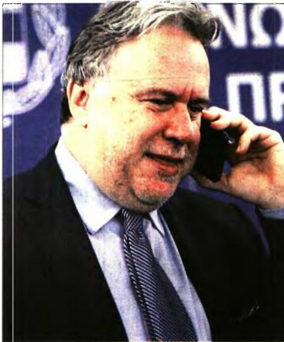
Ο υπουργός Εργασίας Γ. Κατρούγκαλος

• Επικουρική σύνταξη κληρείας από το ΙΚΑ συρρικνώθηκε μετά τον επανυπολογισμό από τα 149 στα 94,27 ευρώ, ενώ το καθαρό ποσό ανέρχεται σε 78,85 ευρώ. Ο συγκεκριμένος συνταξιούχος γλίτωσε τον μηδενισμό της επικουρικής του, αλλά και πάλι με την παρακράτηση των 50 ευρώ θα δει τον ερχόμενο μήνα στον λογαριασμό του σύνταξη 28,85 ευρώ. Αυτό το ποσό θα εισπράττει για τους επόμενους τέσσερις μήνες, καθώς οφείλει να επιστρέψει αναδρομικά συνολικού ύψους 210 ευρώ.