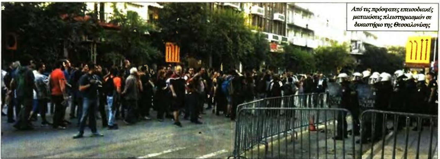
Από τις πρόσφατες επεισοδιακές ματαιώσεις πλειστηριασμών σε δικαστήριο της Θεσσαλονίκης

Ω ς γνωστόν, η πρώτη κατοικία προστατεύεται (ακόμα) για οφειλές προς τις τράπεζες, αλλά δεν προστατεύεται για τα χρέη προς την Εφορία και το Δημόσιο. Το κίνημα κατά των πλειστηριασμών που φουντώνει κάθε Τετάρτη στα Ειρηνοδικεία όλης της χώρας προκαλεί πανικό στο Μαξίμου, που από το «κανένα σπίτι στα χέρια τραπεζίτη» έφτασε στο σημείο να πιετά την μπάλα στην εξέδρα, μιλώντας για αντιδράσεις σε... πλειστηριασμούς για βίλες, για τις οποίες όμως κανείς δεν ξεσπώθηκε!