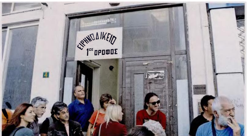
Κινητοποίηση έξω από το Ειρηνοδικείο Περιστερίου. Καμία διαδικασία εκπλειστηριασμού δεν έχει ολοκληρωθεί επιτυχώς τις τελευταίες εβδομάδες.

Οι διαδελωτές κρείσσεται να μείνουν στη θέση τους μόνο για μια ώρα για να πετύχουν τον σκοπό τους: η διαδικασία των πλειστηριασμών διαρκεί από τις 4 έως τις 5 το απόγευμα κάθε Τετάρτη. Η ώρα περνάει υπό τους ήχους του γνωστού συνθήματος που είχε υιοθετήσει και ο σημερινός πρωθυπουργός ως αρχηγός της αντιπολίτευσης («κάνενα σπίτι στα χέρια τραπεζίτη»). Οι συγκεντρωμένοι ξεδιπλώνουν ένα πανό διαμαρτυρίας. Ένα παιδί ζητάει πεντε λεπτά από τους παρευρισκομένους για να αγοράσει κάτι.