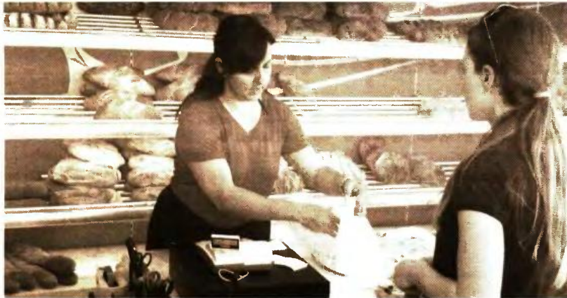
Μισόκιλο για δύο μέρες και... βερεσές παίρνουν πλέον οι καταναλωτές ένεκα κρίσης στον Πύργο

ΔΕΥΤΕΡΑ 12 ΙΟΥΝΙΟΥ 2017 / www.patrisnews.com