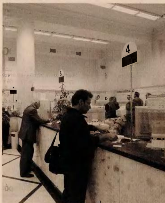
Ο δανειολήπτης έχει πλέον δικαίωμα να κάνει αντιπρόταση στις προτάσεις της τράπεζας και αυτή υποχρεώνεται να απαντήσει εγγράφως, τεκμηριώνοντας ενδεχόμενη αρνητική απάντηση. Επιπλέον, η τράπεζα μπορεί να κάνει νέα βελτιωμένη πρόταση.

επί της διαδικασίας όπως και η ειδοποίηση ότι ο δανειολήπτης αποκαρκτηρίζεται από συνεργάσιμος, θα στέλνεται εγγράφως με διαδικασία που να διασφαλίζει την παραλαβή του από τον δανειολήπτη. Ο παλιός Κώδικας δεν είχε τέτοιες πρόνοιες υπέρ του δανειολήπτη. • Στον νέο Κώδικα ενισχύθηκαν οι αρμοδιότητες και η διαφάνεια λειτουργίας των Επιτροπών Ενστάσεων, που θα λειτουργεί εντός των τραπεζών στις οποίες ο δα-