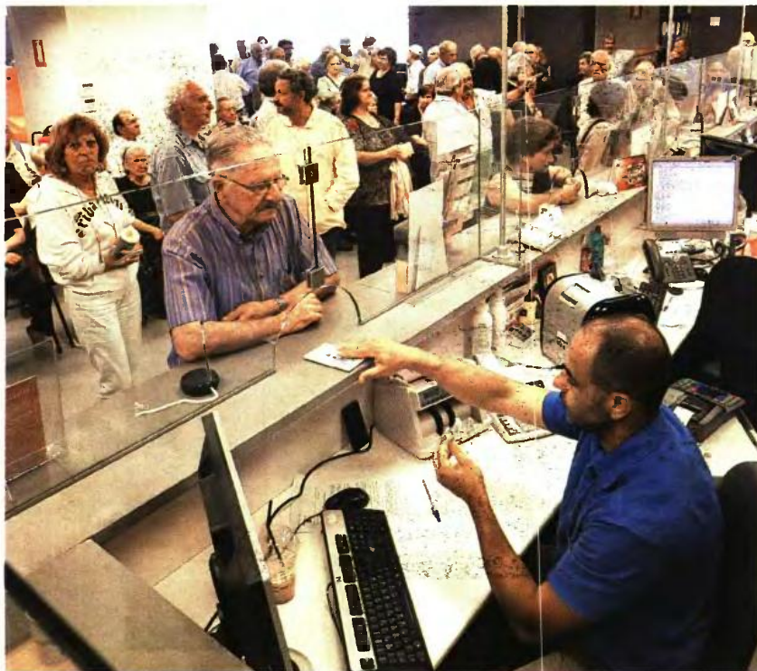
ΤΗ ΔΙΑΔΙΚΑΣΙΑ για τη χορήγηση του Επιδόματος Κοινωνικής Αλληλεγγύης Ανασφάλιστων Υπερήλικων καθορίζει απόφαση του υφυπουργού Εργασίας Αν. Πετρόπουλου

Η αίτηση υποβάλλεται ηλεκτρονικά στον ανταποκριτή του ΟΓΑ του τόπου κατοικίας, εκτυπώνεται, υπο-