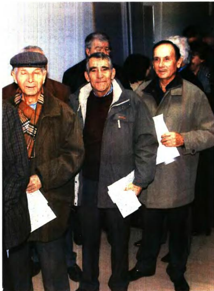
Η ΕΚΠΤΩΣΗ 15% που είχε προβλεφθεί στον ασφαλιστικό νόμο αναπροσαρμόζεται σε 2% για κάθε έτος εξαγοράς. Η ρύθμιση προωθείται άμεσα μαζί με τα άλλα δύο «μέτωπα» του Ασφαλιστικού

1 Αναπροσαρμογή της έκπτωσης 15% που προβλέπεται για όσους εξαγοράζουν εφάπαξ πλασματικά έτη ασφάλισης. Σύμφωνα με πληροφορίες, η νέα ρύθμιση αλλάζει τον μηχανισμό και προβλέπει έκπτωση 2% για κάθε έτος εξαγοράς. Δηλαδή, αν κάποιος εξαγοράζει 7 πλασματικά έτη, θα έχει έκπτωση 14% αν πληρώσει εφάπαξ όλο το ποσό. Αντίστοιχα αν εξαγοράζει 3 έτη, θα έχει έκπτωση 6% κ.ο.κ. Σημειώνεται πως οι ασφαλισμένοι στο Δημόσιο μπορούν να αναγνωρισούν έως και 12 πλασματικά έτη, ενώ στον ευρύτερο δημόσιο και ιδιωτικό τομέα μέχρι 7 χρόνια. Αξιοποιώντας αυτά τα παράθυρα της νομοθεσίας μπορούν να κλειδώσουν