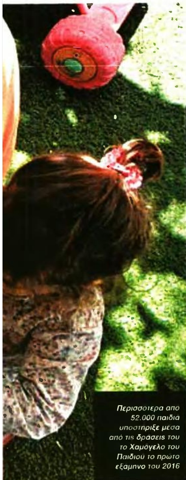
Περισσότερα από 52.000 παιδιά υποστηρίξει μέσα από τις δράσεις του Χαμόγελο του Παιδιού το πρώτο εξάμηνο του 2016

Οικογένειες και παιδιά βιώνουν τα αποτελέσματα της κρίσης. Τα τελευταία χρόνια τα αιτήματα που δέχονται οι ΜΚΟ για οικονομική, υλική αλλά και ψυχολογική υποστήριξη αυξανονται συνεχώς