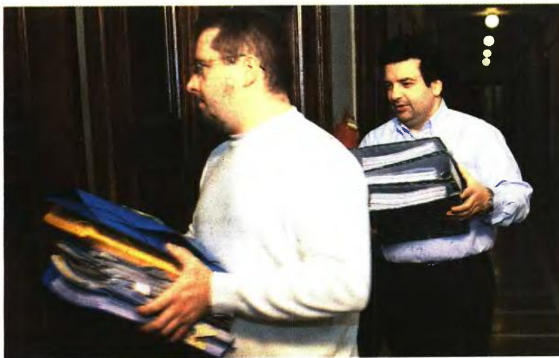
Αμετάβλητος για φέτος ο επίσημος συντελεστής αναπλήρωσης του Μετοχικού Ταμείου Πολιτικών Υπαλλήλων

Υπενθυμίζεται πως σύμφωνα με τον ασφαλιστικό νόμο, ο συντελεστής αναπλήρωσης που καθορίζει το ύψος του μερίσματος αναπροσαρμόζεται εντός του πρώτου 15θμέρου κάθε έτους με γνώμονα τα εκπαιδευμένα επίσημα έσοδα και έξοδα, προκειμένου να αποφεύγεται η δημιουργία ελλειμμάτων. Με τη διατήρηση του συντελεστή στο αρχικό του ύψος, τα μερίσματα που θα κορυφωθούν φέτος δεν θα μειωθούν περαιτέρω, αλλά θα διατηρηθούν στα περσινά επίπεδα. Όπως αναφέρουν αρμόδιες πηγές, τα οικονομικά του Ταμείου σταθεροποιούνται και επιτρέπουν τη συνεπικόλυτη σταθεροποίηση των μερισμάτων. Ο προϋπολογισμός του