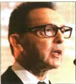
Ο Γ. Στουρνάρας μίλησε χθες για «γενναίους» συντάξεις, παρά τις 13 περικοπές!

ΝΕΑ ΑΥΞΗΣΗ του ορίου ηλικίας συνταξιοδότησης πάνω από τα 67 έτη πρότεινε χθες ο διοικητής της Τραπεζής της Ελλάδος Γιάννης Στουρνάρας σε συνέδριο του Economist, ενώ έφτασε στο σημείο να υποστηρίξει ότι υπάρχουν «γενναίους» συντάξεις στην Ελλάδα, παρά τις 13 περικοπές της τελευταίας επταετίας!