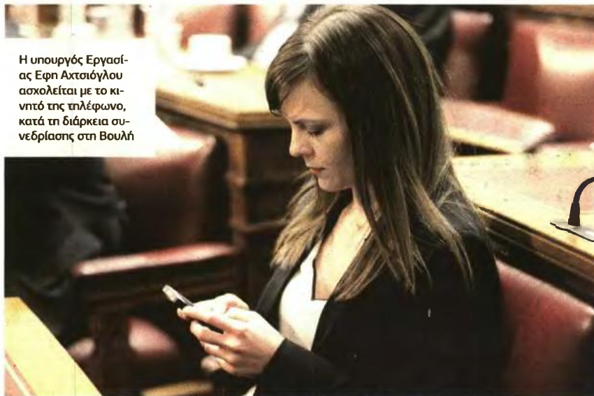
Η υπουργός Εργασίας Εφης Αχτσιόγλου ασχολείται με το κινητό της τηλέφωνο, κατά τη διάρκεια συνεδρίασης στη Βουλή

Σε ανακοίνωσή του ο ΕΦΚΑ αναφέρει ότι, σύμφωνα με τα στοιχεία του, το τρίμηνο Ιανουαρίου - Μαρτίου 2017 εκδόθηκαν και καταβλήθηκαν περισσότερες από 40.000 συντάξεις. «Με αυτά τα δεδομένα, η εκκαθάριση όλων των εκκρεμών αιτήσεων συνταξιοδότησης μέχρι τον Οκτώβριο του 2017, όπως έχει δεσμευθεί η πολιτική ηγεσία του υπουργείου Εργασίας, Κοινωνικής Ασφάλισης και Κοινωνικής Αλληλεγγύης, συνιστά πλήρως εφικτό στόχο» επισημαίνεται χαρακτηριστικά.