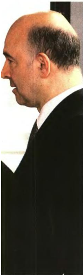
Η επικεφαλής του ΔΝΤ Κριστίν Λαγκάρντ με τον επίτροπο Οικονομικών της Κομισιόν Πιερ Μοσκοβισί, σε παλαιότερο στιγμιότυπο. Δεξιά: Το κθεσινό πρωτοσέλιδο της «ΕΛΕΥΘΕΡΙΑΣ του Τύπου»