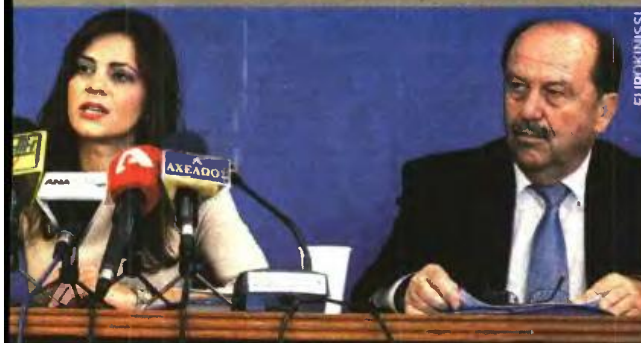
Υπακαλέξης, ομολογούσε ότι «δεν υπάρχει σχέδιο για τη διεκπεραίωση όλων / μπορεί να επιτευχθεί ο στόχος μέχρι τον Οκτώβριο. Μία «βδομάδα αργότερα και υπ. Εργασίας και ΕΦΚΑ ισχυρίστηκαν ότι «ο στόχος είναι πλήρως εφικτός» και οι

Ν ΕΞΟΦΛΗΘΟΥΝ ΕΓΚΑΙΡΑ • ΚΑΜΠΑΝΑΚΙ ΓΙΑ ΝΕΕΣ ΜΕΙΩΣΕΙΣ