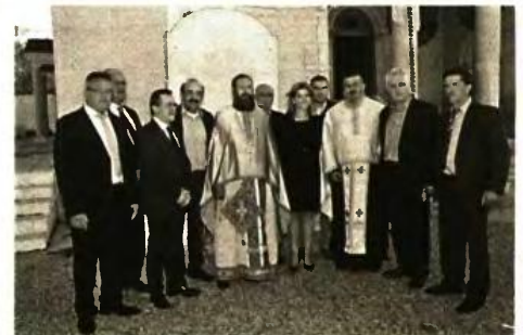
Στιγμιότυπο μετά την κατάθεση στεφάνου στο Ηρώο της Πολύτεκνης Οικογένειας

Μ ε επιτυχία πραγματοποιήθηκε η γιορτή των Πολυτέκνων προς τιμήν των προστατών τους Αγίων Τερεντίου, Νεονίλλης και των επτά τέκνων τους στον Άγιο Ανδρέα Εγλυκάδος την Κυριακή. Στη διάρκεια της θείας λειτουργίας τελέσθηκε αρτοκλασία και, μετά το πέρας, επιμνημόσυνη δέσπη με κατάθεση στεφάνου στο Ηρώο της Πολύτεκνης Οικογένειας που βρίσκεται στον περίβολο