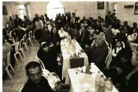
Ακολούθησε εκδήλωση στο Πνευματικό Κέντρο της ενορίας