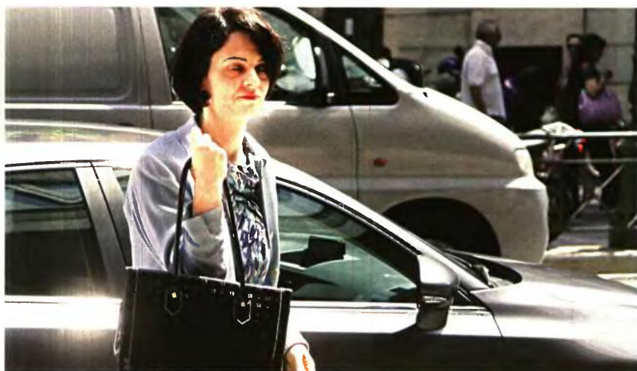
ΕΙΡΗΚΩΝΙΣΣΙ ΠΑΝΑΓΙΩΤΙΝΟΣ ΠΑΝΩΛΗΣ

Η κυβέρνηση, σφόδρα ενοχλημένη από αυτή τη συμπεριφορά, δεν άντεξε χτες και απασφάλισε: διά στόματος του γενικού γραμματέα Δημοσιονομικής Πολιτικής, Φραγκίσκου Κουτεντάκη, άσκησε δριμύτητα επίθεση κατά του Ταμείου αποδίδοντας σε αυτό την ευθύνη για την καθυστέρηση της πρώτης αξιολόγησης. Σε «σκληρή γλώ-