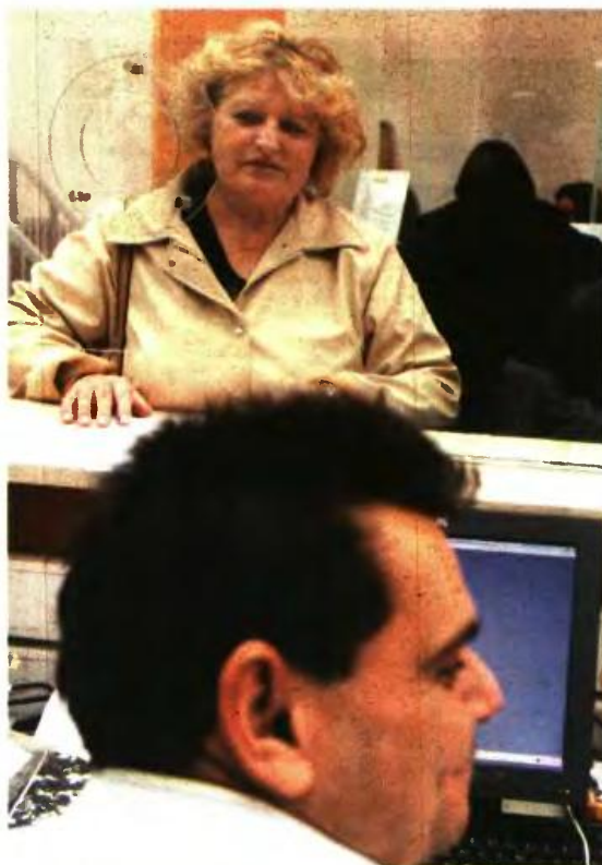
Για τις μητέρες ανηλίκων υπάρχει καθεστώς πρόωρης συνταξιοδότησης στο ΙΚΑ, αλλά όχι στο Δημόσιο