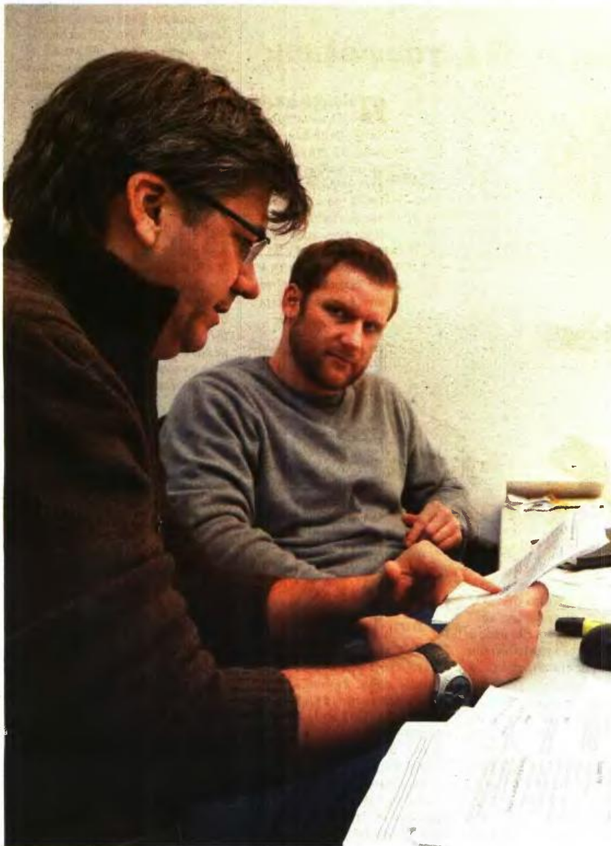
Όσοι έπιασαν τα έτη ασφάλισης και το όριο ηλικίας μέχρι τις 18 Αυγούστου 2015 αποχωρούν με το παλιό συνταξιοδοτικό καθεστώς, εφόσον είχαν θεμελιώσει δικαίωμα έως και το 2012

μπληρώνουν φέτος το 52ο έτος της ηλικίας τους μπορούν να αποχωρήσουν σε ηλικία 56 ετών και 9 μηνών.