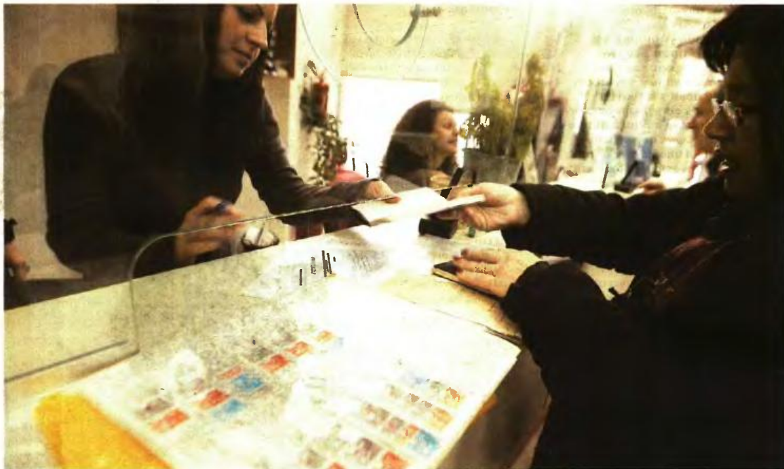
Κλειδωμένο θεωρείται το ύψος της Εθνικής Σύνταξης στα 384 ευρώ για όσους αποχωρούν με 20 χρόνια ασφάλισης και πάνω

■ Ποσοστά αναπλήρωσης. Στο μέγιστο των ποσοστών αναπλήρωσης, η απόσταση που χωρίζει την ελληνική κυβέρνηση και τους δανειστές είναι μεγαλύτερη από ό,τι για την Εθνική Σύνταξη. Κι αυτό επειδή οι νέοι συνταλεστές αναπλήρωσης θα καθοριστούν το τελικό ύψος της νέας