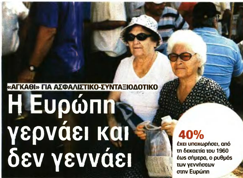
«ΑΓΚΑΘΗ» ΓΙΑ ΑΣΦΑΛΙΣΤΙΚΟ-ΣΥΝΤΑΞΙΟΔΟΤΙΚΟ