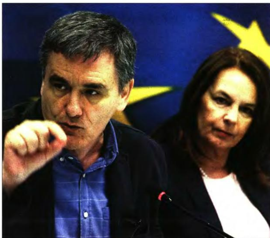
Ο υπουργός Οικονομικών Ευκλείδης Τσακαλώτος με την υφυπουργό Οικονομικών Κατερίνα Παπαναίου

Το α' τρίμηνο, οι εκκρεμείς επιστροφές φόρων για επάνω από 90 μέρες υπερβαίνουν πλέον τα 1,9 δις. ευρώ, εκ των οποίων το 1,1 δις. ευρώ αντιστοιχεί σε αιτήσεις για τις οποίες δεν έχει εκδοθεί καν εκκαθαριστικό επιστροφής!