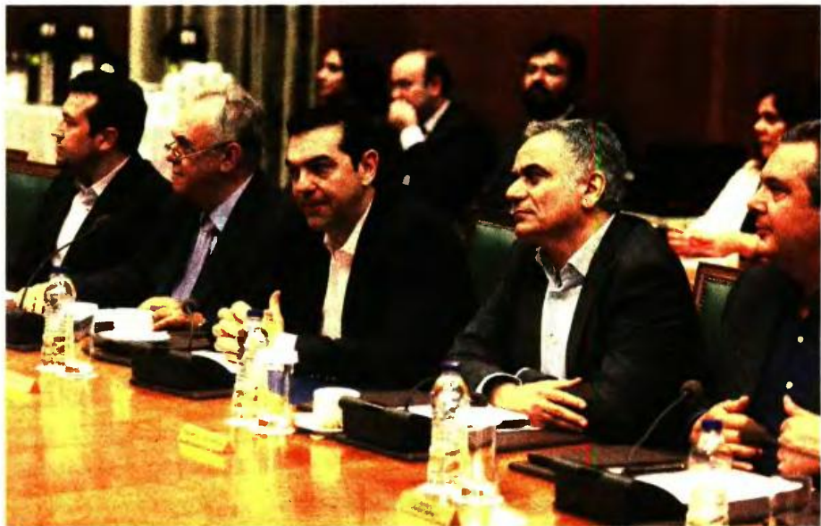
Στον κόσμο του ο πρωθυπουργός, έκανε λόγο στο χθεσινό Υπουργικό για το τέλος της λιτότητας και της εποχής των Μνημονίων.

Μη έχοντας να προτάξει κάτι από όσα τοποθέτησε σε θέση πρωταγωνιστική του προηγούμενου χρονικού διάστημα, όπως το ζήτημα του χρέους και της ένταξης της χώρας στην ποσοτική χαλάρωση, ο πρωθυπουργός αναζήτησε σανίδα πολιτικής σωτηρίας στα περιβόητα αντίμετρα της κυβέρνησης. Αντίμετρα, βέβαια, που θα τεθούν σε εφαρμογή αποκλειστικά και μόνο στην περίπτωση που η Ελλάδα πιάσει τα δυσθεώρητα πρωτογενή πλεονάσματα. «Η τεχνική συμφωνία που καταλήξαμε βρίσκεται στο πνεύμα της