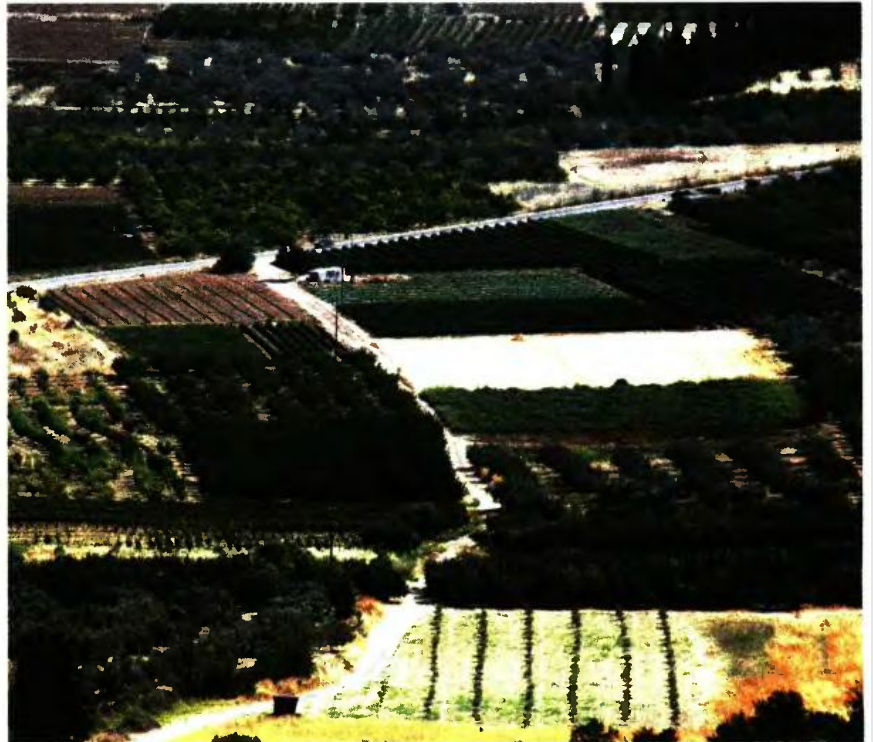
Χιλιάδες καλλιεργητές και ιδιοκτήτες θα έχουν τη δυνατότητα, εφόσον προβούν έγκαιρα στις διαδικασίες που απαιτούνται, να αξιοποιήσουν τις γενναίες εκπτώσεις που φτάνουν έως και 83%.

Επιπλέον, πράσινο φως δίνεται και σε περιοχές αναδασμού για δωρεάν αντιρρήσεις επί των δασικών χαρτών. Πιο συγκεκριμένα, όσες περιοχές χαρακτηρίζονται ως δασικές στη φωτοερμηνεία της παλαιότερης αεροφωτογράφισης, αλλά περιλαμβάνονται σε κληροτεμάχια του αναδασμού. Στην ίδια κατηγορία θα υπάγονται και οι