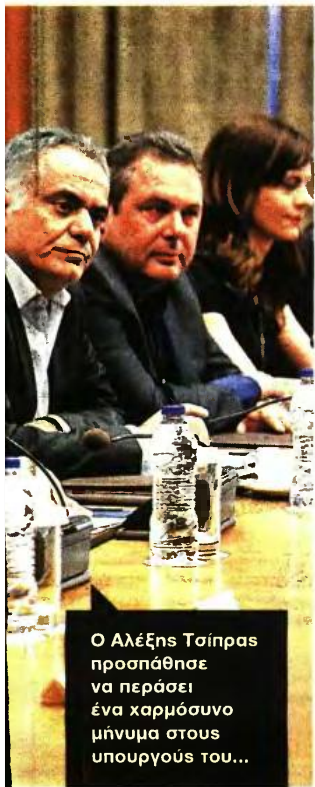
Ο Αλέξης Τσίπρας προσπάθησε να περάσει ένα χαρμόσυνο μήνυμα στους υπουργούς του...

«Μετά την πλήρη εφαρμογή του προγράμματος προσαρμογής θα υπάρξει αξιολόγηση για το εάν είναι αναγκαία μέτρα για το χρέος» αναφέρει ανακοίνωση του γερμανικού υπουργείου Οικονομικών, όπου τονίζεται ότι «δεν ετοιμάζεται καμία ελάφρυνση»