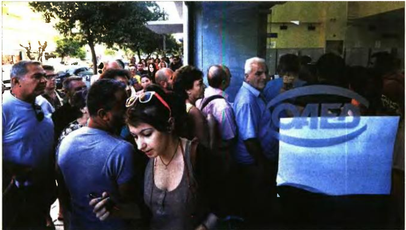
Πολίτες έξω από υποκατάστημα του ΟΑΕΔ (φωτό αρχείου)