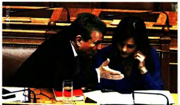
Παρά τις δεσμεύσεις Ακτοϊόγλου-Πετρόπουλου ότι δεν θα γίνουν κατασχέσεις λογαριασμών σε όσους χρωστούν ως 5.000 ευρώ, το ΚΕΑΟ έχει ήδη αποστείλει ειδοποιητήρια σε χιλιάδες μικροοφειλέτες.

εμφανίζει στις ηλεκτρονικές του υπηρεσίες τις παλιές οφειλές, παρά «επιτρέπεται» να βλέπουν οι ασφαλισμένοι μόνον τις τρέχουσες εισφορές τους από την 1/1/2017 και μετά.