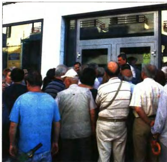
Συνταξιούχοι περμιμένουν σε τράπεζα την ημέρα της πληρωμής των συντάξεων

Από κόσκινο 312.000 συνταξιούχοι. «Μαύρος» Σεπτέμβριος για 1.000.000 δικαιούχους, με τις δεύτερες περικοπές