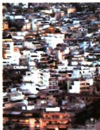
Παγίδα για εκατοντάδες χιλιάδες απόρους αποτελεί ο τρόπος υπολογισμού των εισοδηματικών κριτηρίων για τη χορήγηση απαλλαγών από τον ΕΝΦΙΑ.

Το τελικό αποτέλεσμα θα είναι να κληθούν να πληρώσουν ολόκληρο το ποσό του Ενιαίου Φόρου Ιδιοκτησίας Ακινήτων εκατοντάδες χιλιάδες φτωχοί Έλληνες πολίτες, οι οποίοι στη συντριπτική πλειονότητά τους έχουν πενιχρά ε-