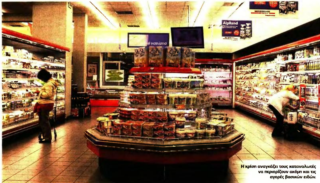
Η κρίση αναγκάζει τους καταναλωτές να περιορίζουν ακόμη και τις αγορές βασικών ειδών.

ΑΚΟΜΑ ΚΑΙ Η ΑΓΟΡΑ ΓΑΛΑΚΤΟΣ ΚΑΤΑΓΡΑΦΕΙ ΜΕΙΩΣΗ 10%