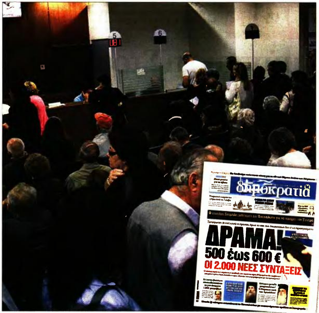
Το χθεσινό πρωτοσέλιδο της «δημοκρατίας» που αποκάλυψε το μεγάλο «αφάδι» στις νέες συντάξεις

Στο «νέο» ποσό σύνταξης που αναγράφεται στις σχετικές αποφάσεις (με βάση τις διατάξεις του ν. 4387/2016), η σύνταξη διαχωρίζεται σε εθνική και ανταποδοτική και το άθροισμά τους είναι