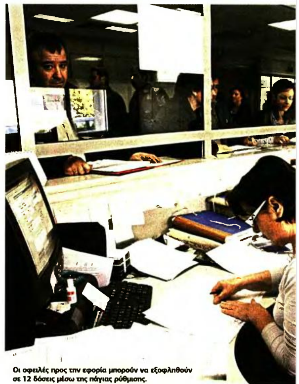
Οι οφειλές προς την εφορία μπορούν να εξοφληθούν σε 12 δόσεις μέσω της πάγιας ρύθμισης.

3 Η τμηματική αποπληρωμή του ληξιπρόθεσμου χρέους ανά μη τακτά διαστήματα με την καταβολή ποσών «έναντι», ιδίως αν το ποσό του χρέους υπερβαίνει κατά πολύ τα 500 ευρώ. Η λύση αυτή πρέπει να επιλέγεται εφόσον είναι αδύνατη η υπαγωγή του χρέους σε «πάγια ρύθμιση» και