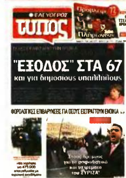
Ο Ελεύθερος Τύπος από τις 5 Φεβρουαρίου είχε αποκαλύψει ότι η τρόικα απαιτούσε να μπει τέλος στην αυτοδίκαιη απόλυση στα 60 με 35 έτη υπηρεσίας και ζητούσε παραμονή μέχρι τα 67.

με τα κατά περίπτωση όρια ηλικίας που ισχύουν κάθε φορά.