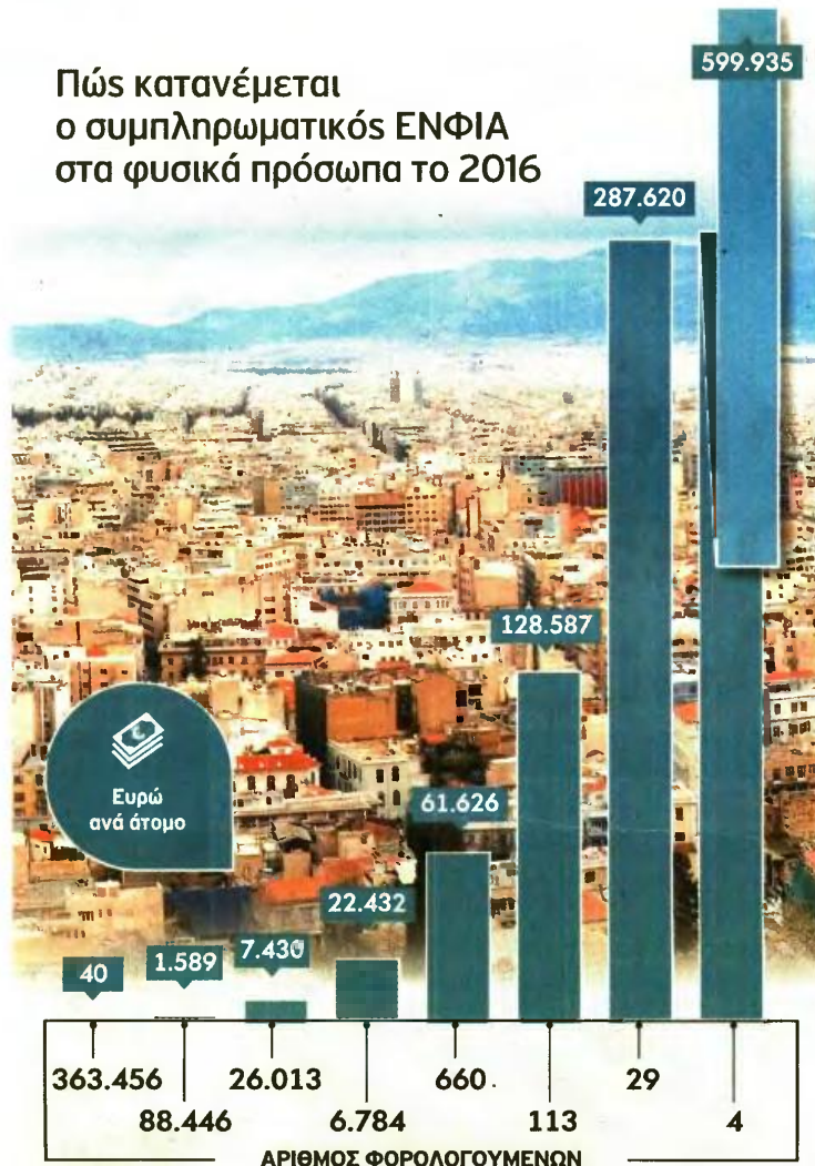
ΕΚΤΙΜΗΣΕΙΣ ΤΟΥ ΣΕΒ