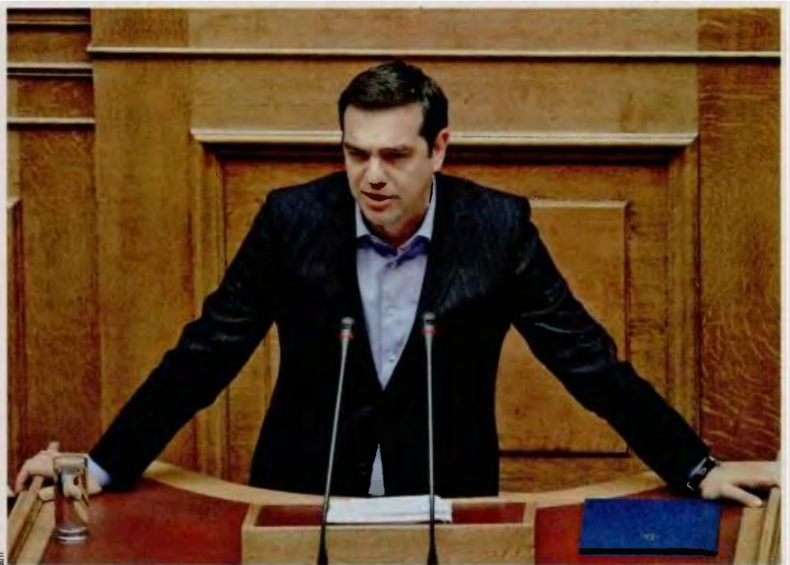
Έχουν επανακάμψει εισηγήσεις από στενούς συνεργάτες του πρωθυπουργού Αλέξη Τσίπρα για ενδεχόμενη επίθεση του ανασχηματισμού του υπουργικού συμβουλίου.

Το κλίμα στο Μαξίμου είναι βαρύ στον απόηχο δημοσίων παρεμβάσεων, όπως η τοποθέτηση του κυβερνητικού εταίρου κ. Πάνου Καμμένου περί αντι-συνταγματικότητας της αύξησης του ΦΠΑ στα νησιά, με την οποία εν μέρει συντάχθηκε χθες ο πρόεδρος της Βουλής Νίκος Βούτσας. Η κατάσταση επιδεινώνεται από τοποθετήσεις όπως αυτή της