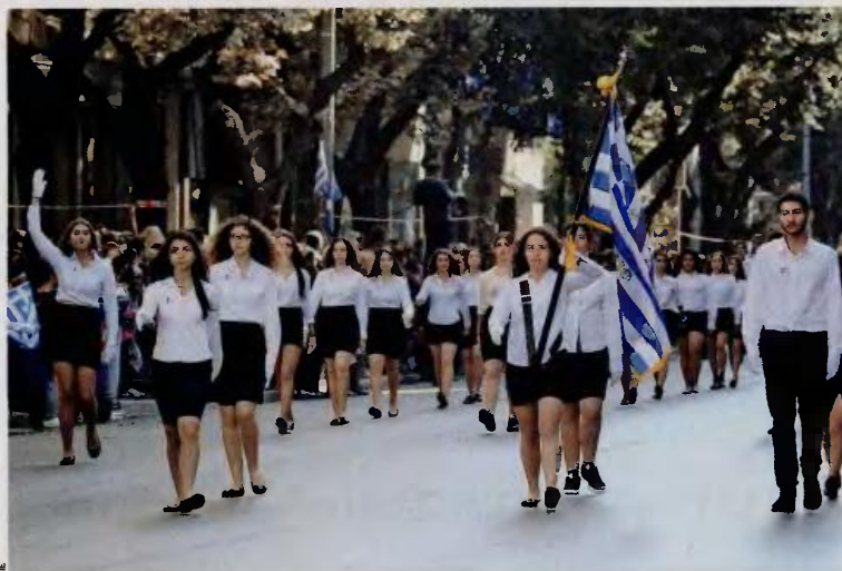
Η κατάργηση των μαθητικών παρελάσεων είναι ανάμεσα στο πακέτο αλλαγών, που ήδη συναντά αντιδράσεις. Πολλές από τις προτάσεις της Επιτροπής, άλλωστε, κρίνονται ανεφάρμοστες.