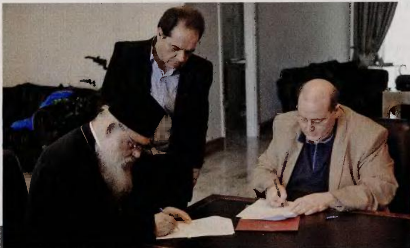
Ο Αρχιεπίσκοπος Ιερώνυμος και ο υπουργός Παιδείας Νίκος Φίλης υπέγραψαν, χθες, σύμφωνο συνεργασίας για την ενίσχυση οικονομικά αδύναμων μαθητών και των οικογενειών τους.

Στη συνάντηση συζητήθηκε η εφαρμογή των εκπαιδευτικών προγραμμάτων που εφαρμόζει σε ανήλικους πρόσφυγες η «Αποστολή».