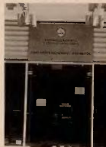
Το υπάρχον φορολογικό σύστημα διογκώνει τα αδήλωτα εισοδήματα, σύμφωνα με μελέτη που εκπόνησε η PwC.

Ο συνολικός επανασχεδιασμός του φορολογικού συστήματος στην κατεύθυνση της απλοποίησης, της μείωσης των συντελεστών και της αύξησης των αφορολόγητων ορίων εμφανίζεται ως η βασική απαίτηση εξορθολογισμού και επαναζυγίσματος του φορολογικού συστήματος, ώστε το τελευταίο να καταστεί οικονομικά αποτελεσματικότερο, διευκολύνοντας την ανάπτυξη.