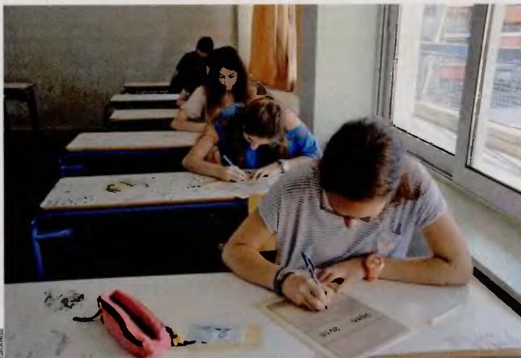
«Τέλος» στις Πανελλαδικές Εξετάσεις βάζει η πρόταση της Επιτροπής για την Παιδεία. Σήμερα οι υποψήφιοι Γενικού Λυκείου εξετάζονται στα μαθήματα της Βιολογίας και της Πληροφορικής Προσανατολισμού.

Ως προς την οργάνωση των σχολικών μονάδων προτείνονται εξασφάλιση ισχυρής ηγεσίας στα σχολεία, μεγαλύτερα Γυμνάσια προς την κατεύθυνση της δημιουργίας τετρατάξιων Γυμνασίων (κατά 25% μεγαλύτερα) και τη δημιουργία λιγότερων αλλά πολυπληθέστερων Λυκείων, μερικά από τα οποία θα προέλθουν από συγχωνεύσεις, όπου θα καταστεί δυνατόν να δημιουργηθούν τάξεις με επιλογές μαθημάτων.