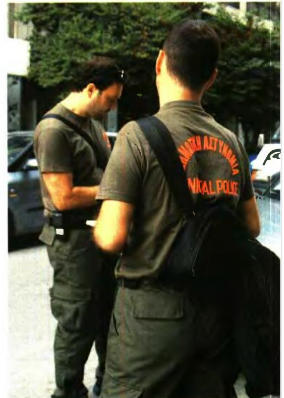
ΣΕΙΡΑ ΑΛΛΑΓΩΝ για τους εργαζόμενους στην Τοπική Αυτοδιοίκηση φέρνει το νομοσχέδιο του υπουργείου Εσωτερικών