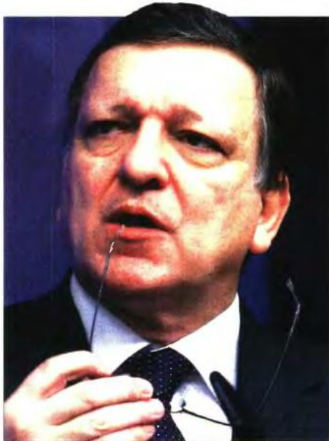
Ο πρώην πρόεδρος της Κομισιόν Ζοζέ Μανουέλ Μπαρόζο

Με βάση την πρώτη επικαιροποίηση του τρίτου Μνημονίου, η ενεργοποίηση του Κατοχικού Ταμείου Αποκρατικοποιήσεων και η επιλογή των προσώπων που θα στελεχώσουν τα όργανα διοίκησης τους, η περαιτέρω απελευθέρωση της αγοράς ενέργειας και οι αλλαγές στις διοικήσεις των ελληνικών τραπεζών έπρεπε να είχαν ήδη προχωρήσει έως το τέλος Ιουνίου.