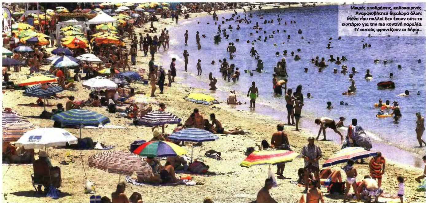
Μικρές αποδράσεις, καλοκαιρινές. Αναμφισβήτητο δικαίωμα όλων. Μόνο που πολλοί δεν έχουν ούτε το εισιτήριο για την πιο κοντινή παραλία. Γι' αυτούς φροντίζουν οι δήμοι...

ΤΟΠΙΚΕΣ ΑΡΧΕΣ ΠΡΟΣΦΕΡΟΥΝ «ΑΝΑΣΣΕΣ» ΔΡΟΣΙΑΣ ΣΕ ΑΠΟΡΟΥΣ, ΑΝΕΡΓΟΥΣ ΚΑΙ ΑΛΛΕΣ ΕΥΠΑΘΕΙΣ ΟΜΑΔΕΣ