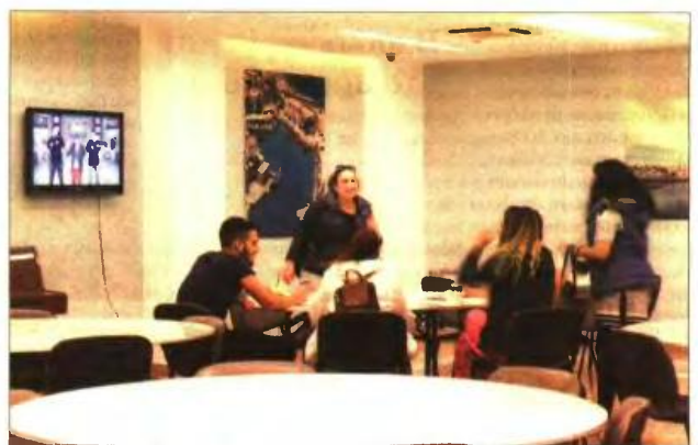
Φοιτητές συζητούν γύρω από την τηλεόραση, στον χώρο του εστιατορίου

Ακόμα και οι δωρεές, όμως, έχουν συρρικνωθεί τα τελευταία χρόνια, καθώς ενώσεις και φορείς που παραδοσιακά στήριζαν την Κρητική Εστία δυσκολεύονται να ανταποκριθούν στις οικονομικές υποχρεώσεις τους. «Έχουν περιοριστεί πολύ οι δωρεές. Όπως λέει και η παροιμία, όταν δημάει η αυλή σου, δεν χύνεις το νερό απέξω. Ευτυχώς, έχουμε και βοήθεια σε είδος, σε τρό-