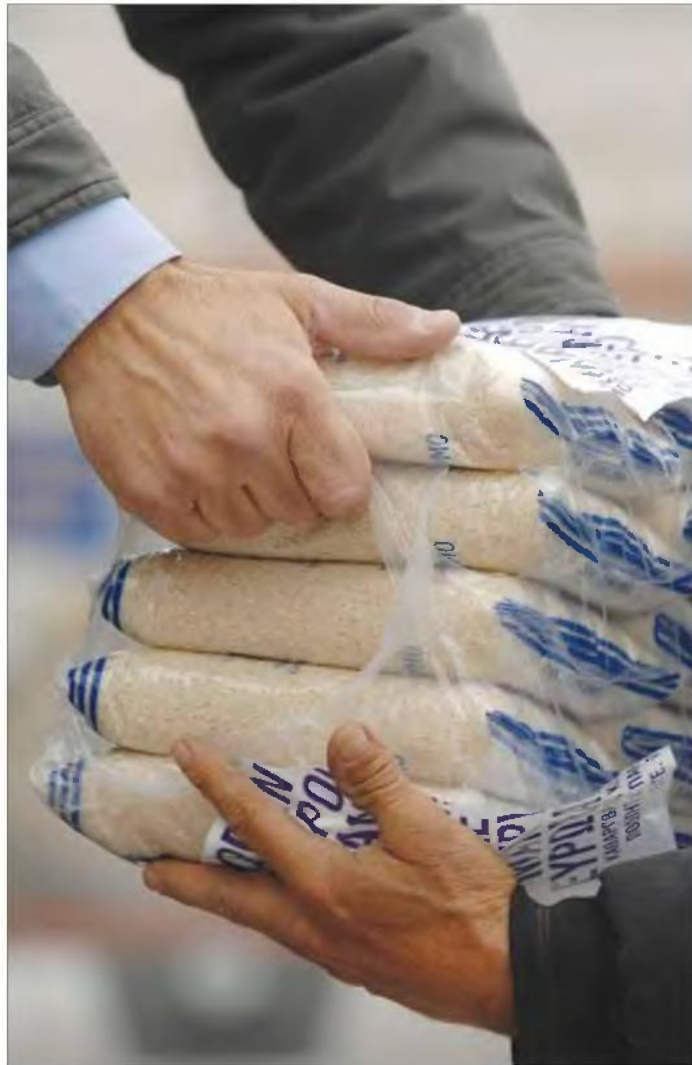
Η διανομή θα γίνει από τις εργατικές κατοικίες των Πατελών, επί της οδού Σολωμού, κοντά στα γραφεία του Συλλόγου ΑμεΑ.

Η διανομή της δεύτερης δόσης υπολογίζεται ότι θα ξεκινήσει στις 18-19 Απριλίου, ενώ θα υπάρξει και τρίτη δόση που θα περιλαμβάνει ευπαθή προϊόντα