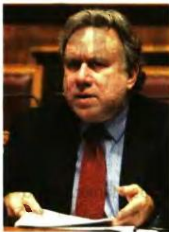
Ο ΥΠΟΥΡΓΟΣ Εργασίας Γ. Κατρούγκαλος

1 Οι ιδιοκτήτες τουριστικών καταλυμάτων που δραστηριοποιούνται σε δήμους κάτω των 2.000 κατοίκων και δηλώνουν ετήσιο εισόδημα κάτω από 10.000 ευρώ