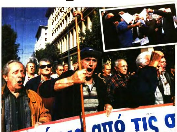
Συνταξιούχοι έκαψαν χθες πορεία στο κέντρο της Αθήνας και έκαψαν τις επιστολές Κατρούγκαλου

«Δεν δεχόμαστε να ζούμε μέσα στη φτώχεια, βλέποντας να θυσιάζεται το μέλλον των παιδιών μας. Οι συντάξεις μας μειώθηκαν κατά 50%» τόνισαν μέλη των ενώσεων συνταξιούχων της περιοχής, που πήραν τον λόγο στη συγκέντρωση που πραγματοποιήθηκε στην κεντρική πλατεία της Λάρισης.