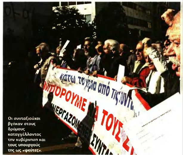
Οι συνταξιούχοι βγήκαν στους δρόμους καταγγέλλοντας την κυβέρνηση και τους υπουργούς της ως «ψεύτες».

5 Μειώθηκαν όχι μόνον οι επικουρικές, αλλά έπεσε ψαλίδι στα οικογενειακά και τα αναπηρικά επιδόματα που καταβάλλονται στους δικαιούχους με προστατευόμενα μέλη (σύζυγο) ή με αναπηρία. Για παράδειγμα, το επίδομα αναπηρίας είναι ίσο με το 50% της εκάστοτε