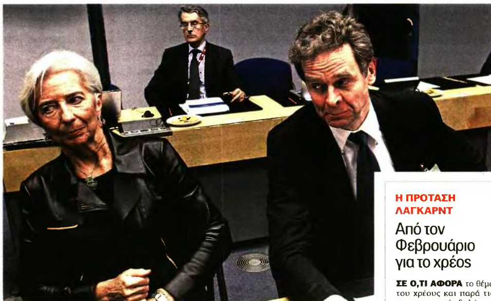
Η πρόταση της Λαγκάρντ για το χρέος είχε απορριφθεί από τον μέχρι πρότινος υπουργό Οικονομικών της Γερμανίας κ. Βόλφγκανγκ Σόιμπλε.

Εργασιακά, απεργίες, συντάξεις, επιδόματα, Δημόσιο και απελευθέρωση της αγοράς ενέργειας στην ατζέντα των συζητήσεων