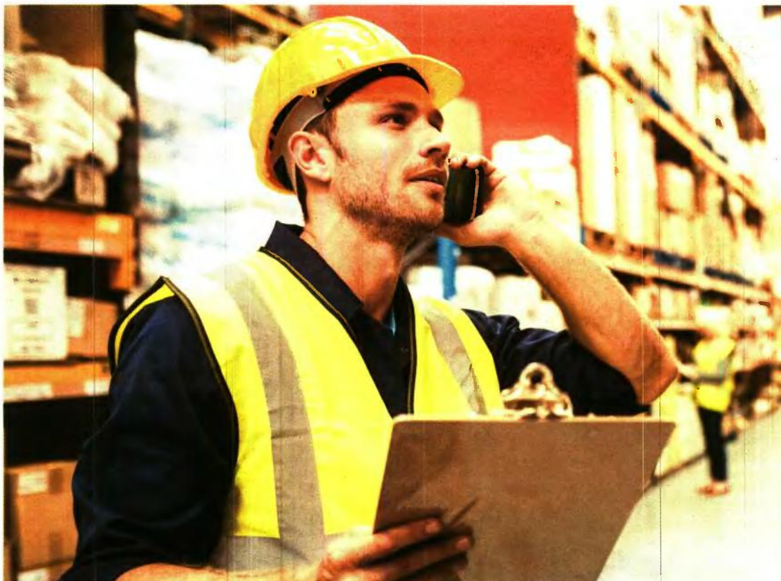
Τα προγράμματα ενίσχυσης της επιχειρηματικότητας στοχεύουν σε τομείς όπου η ελληνική οικονομία εμφανίζει συγκριτικά πλεονεκτήματα, όπως η αγρο-

Ήδη από τα προγράμματα του ΕΣΠΑ, τα προγράμματα του ΕΠΑΝΕΚ τρέχουν δράσεις για την ενίσχυση της μικρομεσαίας επιχειρηματικότητας. Λόγω και της μεγάλης ζήτησης που παρουσιάστηκε, το υπουργείο Οικονομίας προχώρησε σε μια σειρά από διαδικασίες αυξήσεων των προϋπολογισμών, η τελευταία ανακοινώθηκε πριν από δύο εβδομάδες και