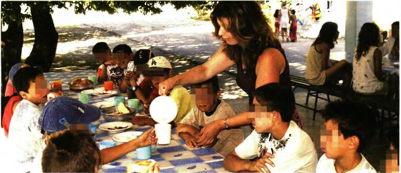
Το νέο προσωπικό θα αναλάβει τη λειτουργία συνολικά 31 κατασκηνώσεων τόσο στην Αττική όσο και στην περιφέρεια

ΖΗΤΗΣΗ ΓΙΑ ΠΡΟΣΩΠΙΚΟ ΔΙΑΦΟΡΩΝ ΕΙΔΙΚΟΤΗΤΩΝ