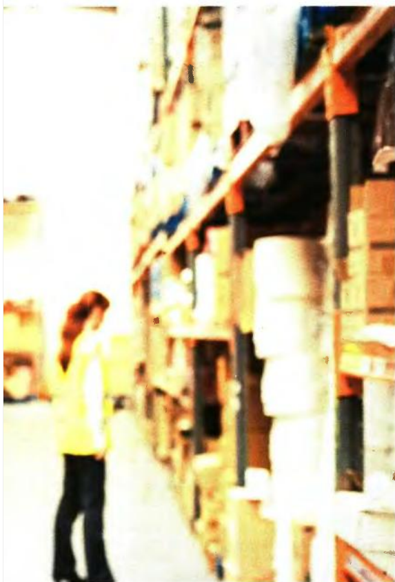
τροφή, η πληροφορική, οι μεταφορές και η ενέργεια

γράφθηκε πριν από λίγες μέρες για τη μεταποίηση τροφίμων και ποτών. Έχει ήδη εφαρμογή σε 98 διαφορετικές επιχειρηματικές δραστηριότητες σε 32 τομείς της βιομηχανίας τροφίμων και ποτών, ενώ ακολουθεί η υπογραφή σχετικής υπουργικής απόφασης για τα καταστήματα υγειονομικού ενδιαφέροντος.