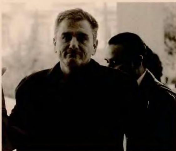
Πολύωρη ήταν η σύσκεψη μεταξύ του υπουργού Οικονομικών Ευκλ. Τσακαλώτου και των επικεφαλής της τρόικας για το νέο ταμείο αποκρατικοποιήσεων.