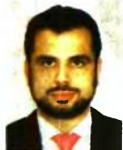
Γράφει ο Διονύσιος Ρίζος