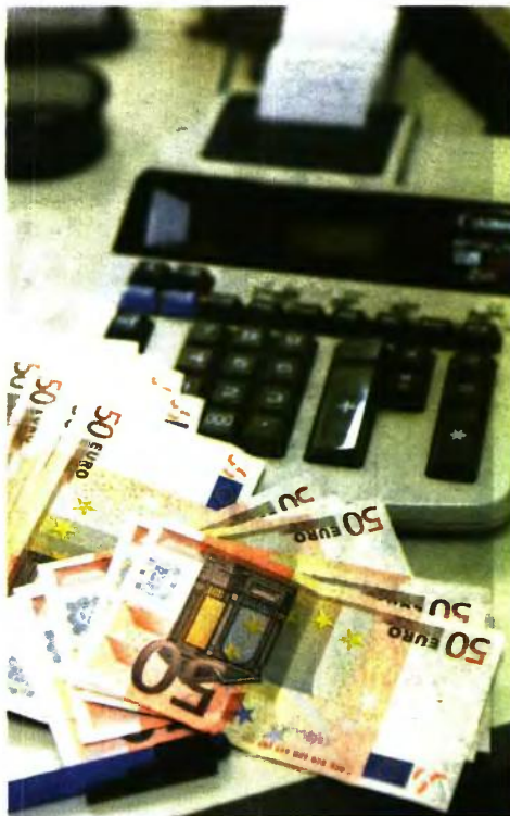
Οι ασφαλισμένοι που υποβάλλουν αίτηση συνταξιοδότησης από τις 13 Μαΐου 2016 και εντεύθεν εμπίπτουν στον νέο τρόπο υπολογισμού, που είναι ίδιος τόσο στον δημόσιο όσο και στον ιδιωτικό τομέα

Οι μεταβατικές διατάξεις του νόμου που δίνουν προσωπική διαφορά για την πρώτη ζετία και