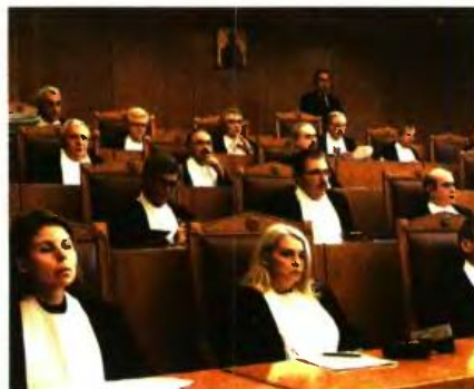
Ο ΠΑΝΕΛΛΗΝΙΟΣ Ιατρικός Σύλλογος προσέφυγε στο ΣΤΕ ενόπτιο στη μείωση των συντάξεων και στον νέο τρόπο υπολογισμού των εφάπαξ παροχών πρόνοιας