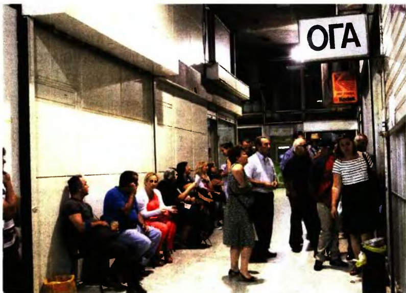
ΤΟ ΕΠΙΔΟΜΑ ΑΝΑΣΦΑΛΙΣΤΩΝ ΑΝΩ ΤΩΝ 67 ΕΤΩΝ ΑΠΟ ΤΟΝ ΟΓΑ