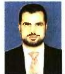
Επιμέλεια: ΔΙΟΝΥΣΗΣ ΡΙΖΟΣ Δικηγόρος, ειδικός σε θέματα κοινωνικής ασφάλισης