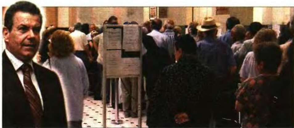
Οι δικαιούχοι δεν θα χρειαστεί να κάνουν αίτηση. Ενθετή: Ο υφ. Κοινωνικής Ασφάλισης Τάσος Πετρόπουλος

Ο κ. Πετρόπουλος, χθες, επανέλαβε ότι οι δικαιούχοι επικουρικών συντάξεων, από τους οποίους έχουν παράνομα παρακρατηθεί επιπλέον ποσά υπέρ ΑΚΑΓΕ, δεν χρειάζεται να υποβάλουν δηλώσεις προς το νέο ενιαίο επικουρικό ταμείο. Ο υφυπουργός, δικαιώνοντας τη θέση της «δημοκρατίας», δεσμεύτηκε ότι η κυβέρνηση θα επιστρέψει τις παράνομες παρακρατήσεις όπως έπραξε και με τις εισφορές για τον ΕΟΠΥΥ. «Ετσι θα το κάνουμε και για το ΑΚΑΓΕ» τόνισε ο κ. Πετρόπουλος, διαμνύοντας προς τους δικαιούχους επικουρικών συντάξεων ότι «δεν χρειάζεται να κάνουν αιτήσεις οι ασφαλισμένοι». Σύμφωνα με τον κ. Πετρόπουλο, από το σύνολο των συνταξιούχων που λαμβά-