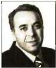
ΠΑΝΟΣ ΑΜΥΡΑΣ paniras @e-typos.com

Μ πορεί τα νέα να έχουν βουίξει σε όλο τον κόσμο αλλά στο Μαξίμου το κρατούν ακόμη μυστικό. Η γερμανική εφημερίδα «Handelsblatt» έγραψε προχθές ότι ο Τσίπρας εξετάζει την πιθανότητα των πρόωρων εκλογών ώστε να προλάβει την προγραμματισμένη για τον Δεκέμβριο του 2018 μείωση των συντάξεων. Αυτό ήταν το βασικό κυβερνητικό σχέδιο. Να οδηγήσουν τη χώρα στις κάλπες τον προσεχή Σεπτέμβριο με νωπές ακόμη τις «δάφνες» από την εικονική έξοδο από τα Μνημόνια τον Αύγουστο.