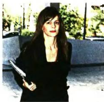
«Οι συλλογικές διαπραγματεύσεις θα πρέπει να είναι κύρια συνιστώσα του ευρωπαϊκού πυ-

Το «πακέτο» των εργασιακών φαίνεται να έχει «τεμαχιστεί», καθώς το θέμα των ομαδικών απολύσεων και του «κλοκ άουτ», που θέτει κυρίως το ΔΝΤ στη διαπραγμάτευση, ενδέχεται να αντιμετωπιστούν σε μεταγενέστερο χρόνο. Όχι μόνο λόγω της εκκρεμότητας του Ευρωπαϊκού Δικαστηρίου, που θα αποφανθεί πιθανότατα μέχρι το τέλος Δεκεμβρίου για το «ποιο όργανο θα εγκρίνει το σχετικό αίτημα μιας επιχείρησης για ομαδικές απολύσεις», αλλά και γιατί φαίνεται να έχει μείνει πίσω στην ατζέντα της διαπραγμάτευσης. Αντιθέτως για το θέμα των συλλογικών συμβάσεων, υπήρξε συνέχεια και σε επίπεδο υπουργών Εργασίας.