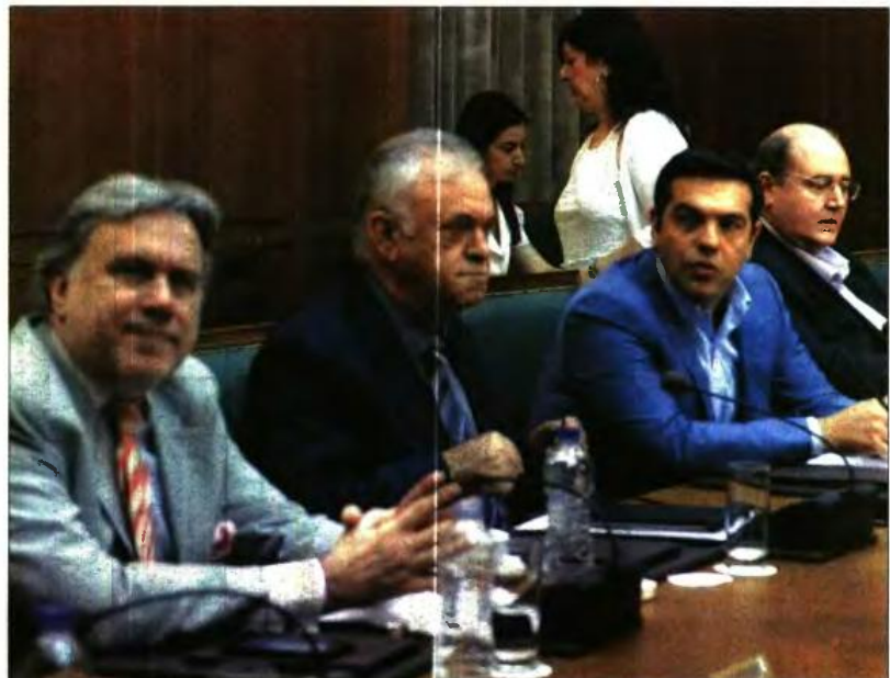
Ο Αλέξης Τσίπρας στη χθεσινή συνεδρίαση του Κυβερνητικού Συμβουλίου Οικονομικής Πολιτικής

• Στην Παιδεία: ιδρύονται νέα ειδικά σχολεία και νέα τμήματα ένταξης, και θα προσληφθούν εντός του καλοκαιριού περίπου 800 αναπληρωτές εκπαιδευτικοί.