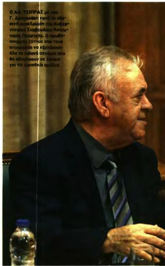
Ο ΑΛ. ΤΣΙΠΡΑΣ με τον Γ. Δραγασάκη κατά τη κλειστή συνεδρίαση του Κυβερνητικού Συμβουλίου Κοινωνικής Πολιτικής. Ο πρωθυπουργός ζήτησε από τους υπουργούς να εξετάσουν όλα τα πιθανά σενάρια που θα οδηγήσουν σε λύσεις για τις ευπαθείς ομάδες

■ Ο έβδομος πυλώνας είναι η Παιδεία. Ιδρύονται νέα Ειδικά Σχολεία και τμήματα ένταξης. «Διευρύνουμε το πλαίσιο υποστήριξης των σχολείων Γενικής Εκπαίδευσης με ψυχολόγους και κοινωνικούς λειτουργούς. Επίσης τον Σεπτέμβριο ξεκινά η μεγάλη προσπάθεια ένταξης όλων των προσφύγων που βρίσκονται στη χώρα μας στο εκπαιδευτικό σύστημα» ανέφερε ο πρωθυπουργός.