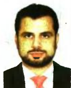
Γράφει ο Διονύσιος Ρίζος

Ετσι συρρικνωμένο εισόδημα θα δουν να καταβάλλεται περίπου 300.000 συνταξιούχοι όλων των Ταμείων. Από αυτούς στα μαλακά θα πέσουν οι δημόσιοι υπάλληλοι που λαμβάνουν την επικουρική τους σύνταξη από το πρώην ΤΕΑΔΥ, καθώς