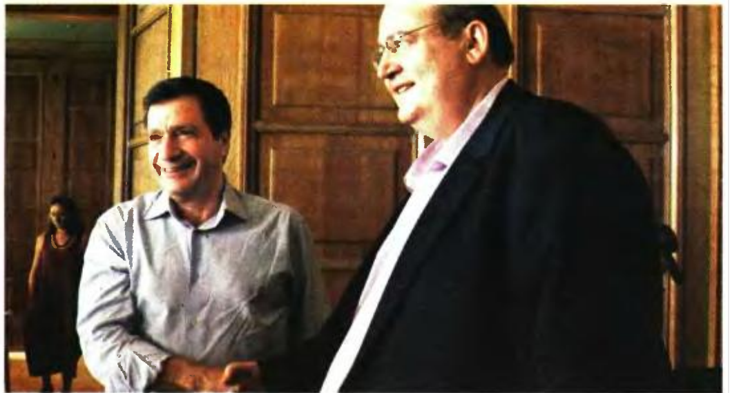
ΜΕΤΡΑ ΥΠΟΣΤΗΡΙΞΗΣ μαθητών και φοιτητών ανακοίνωσαν Γ. Καμίνης και Ν. Φίλης

Με αφορμή την πρόσφατη κατάληψη του Νοσοκομείου Πατυσίων, ο Γ. Καμίνης προειδοποίησε ότι δεν πρόκειται να ανεχθεί να συνεχιστεί αυτή η κατάσταση σε ιστορικά κτίρια του δήμου, ενώ ανακοίνωσε πως θα καταθέσει μηνυτήρια αναφορά -όπως έχει πράξει και σε άλλες περιπτώσεις- περιμένοντας, όπως είπε, να δει «ποια θα είναι η αντίδραση της Πολιτείας». Ο δήμαρχος Αθηναίων ανέφερε ότι, μέχρι στιγμής, δεν έχει αντιδράσει ούτε το αρμόδιο υπουργείο ούτε κανείς άλλος, σημειώνοντας πως οι συνθήκες σε αυτά τα κτίρια είναι άθλιες. «Οι άνθρωποι αυτοί δεν αξίζουν αυτή την τύχη, αλλά ούτε και η πόλη αυτή την υποβάθμιση και αυτή την ανεξέλεγκτη κατάσταση», τόνισε, ενώ επανέλαβε πως ο Δήμος Αθηναίων «δεσμεύεται ότι μπορεί