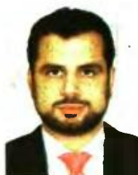
Γράφει ο Διονύσιος Ρίζος

Ετσι συρρικνωμένο εισόδημα θα δουν να καταβάλλεται περίπου 300.000 συνταξιούχοι όλων των Ταμείων. Από αυτούς στα μαλακά θα πέσουν οι δημόσιοι υπάλληλοι που λαμβάνουν την επικουρική τους σύνταξη από το πρώην ΤΕΑΔΥ, καθώς